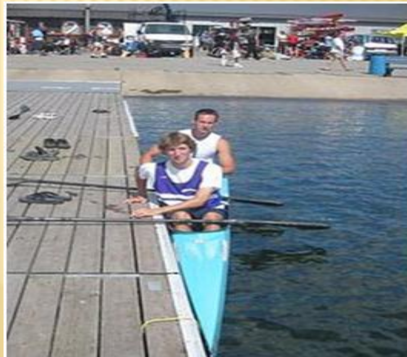
Гребля на байдарке-двойке