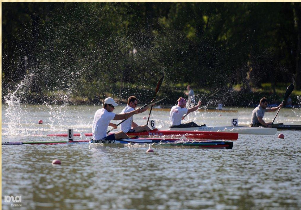
Гребля на каноэ- одиночке