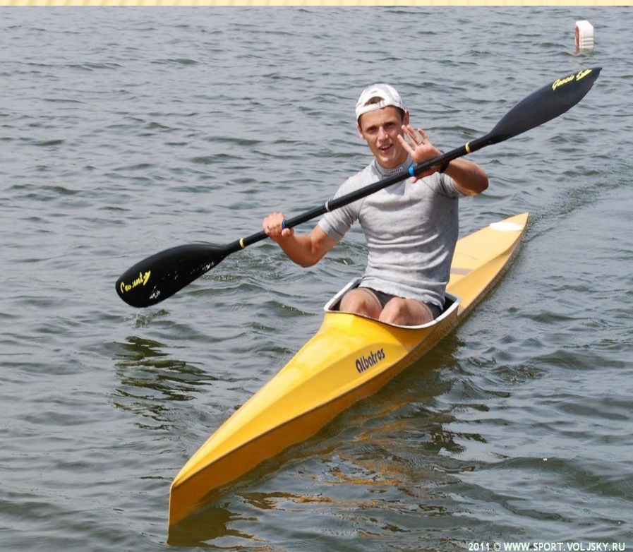
Гребля на каноэ-одиночке