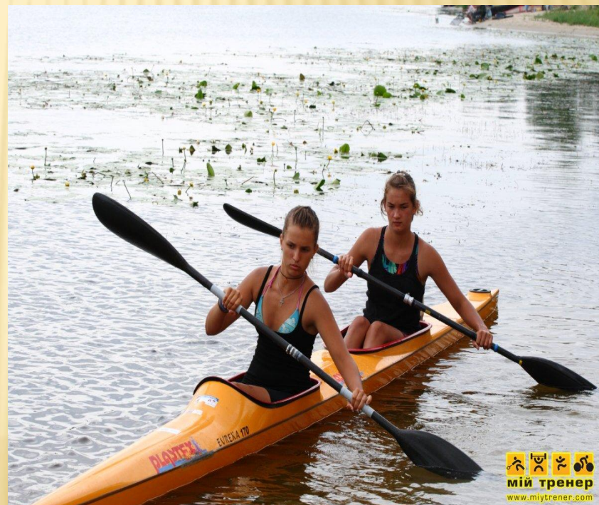
Гребля на байдарке-двойке