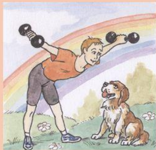
Электронная версия газеты "Спорт в школе"