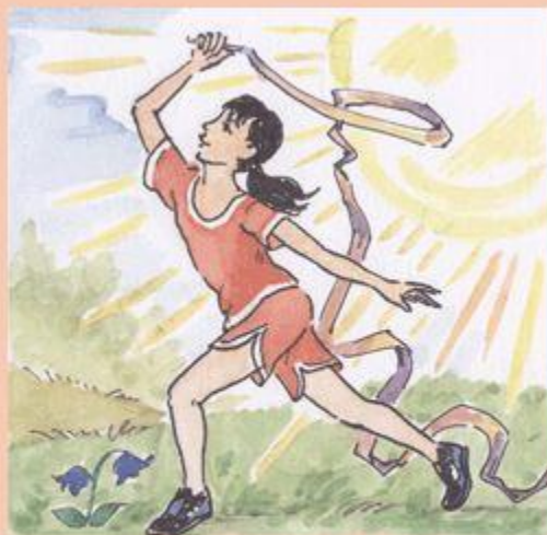
Сайт для учителей "Я иду на урок физкультуры"