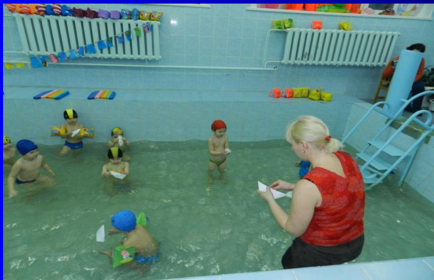
Сказка «Карась и ёлочки»