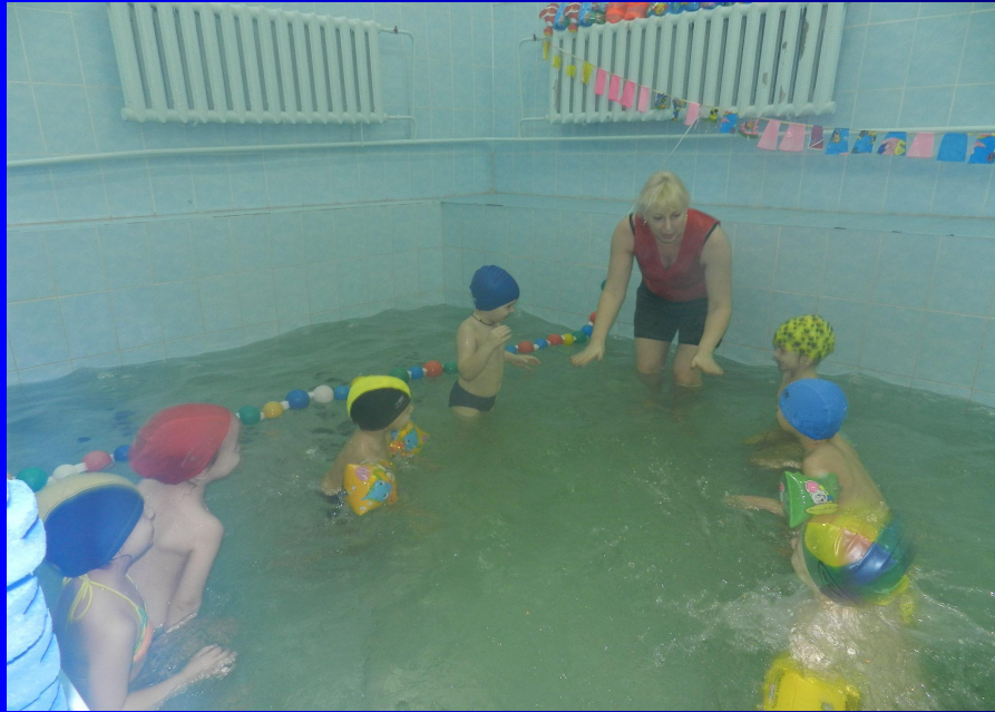
Сказка «Разноцветные камешки»