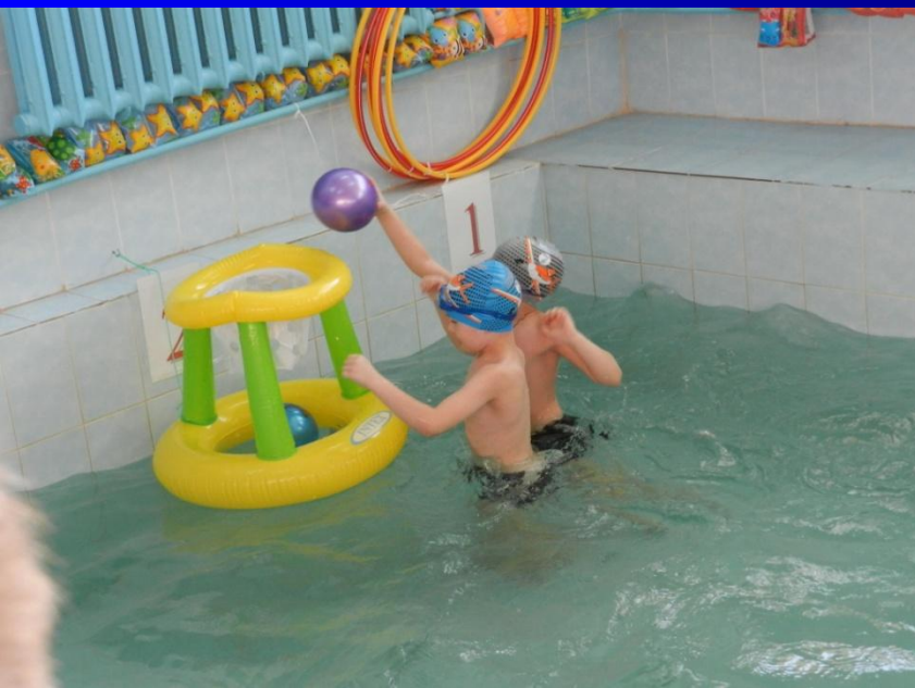
Сказка «Сломанный Корабль»