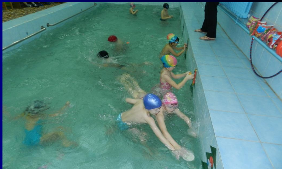
Сказка «Карась и ёлочки»