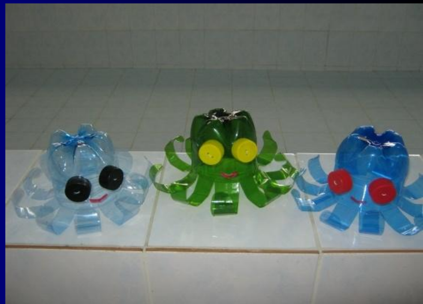
Сказка «Быстрые Гонцы»