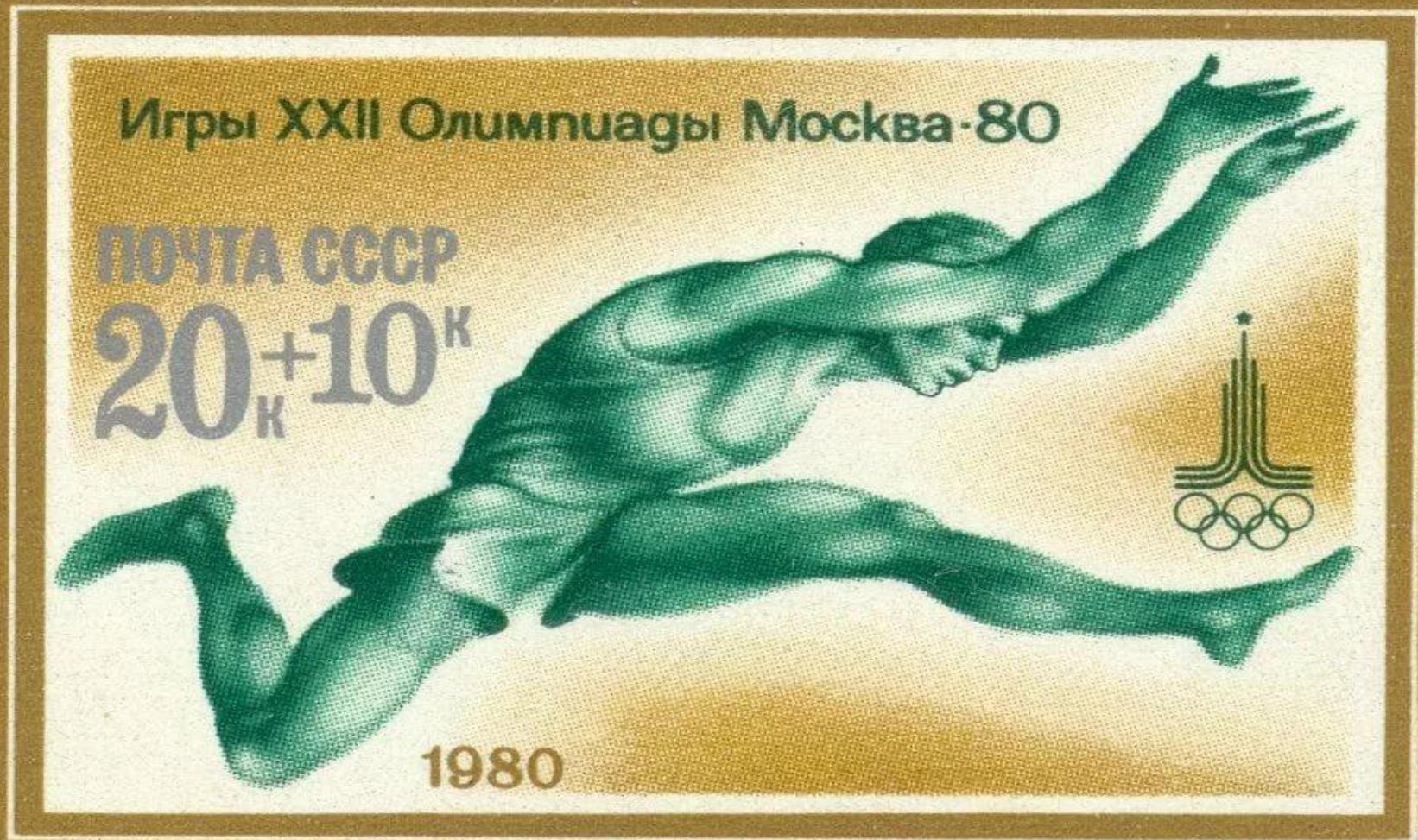
Прыжок в длину на марке СССР, посвящённой Олимпиаде-80