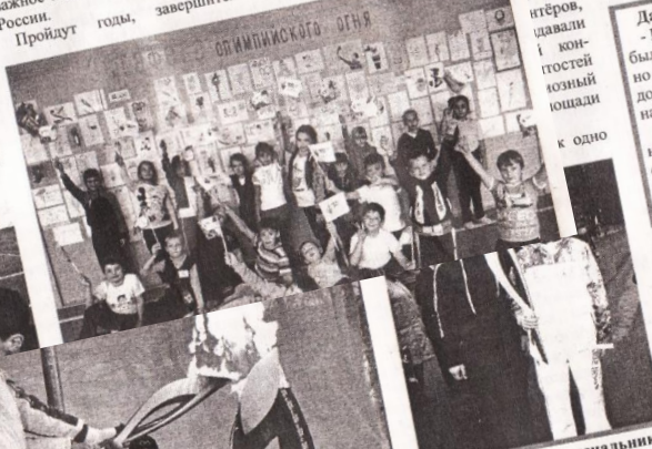
Каждый ребенок с олимпийской символикой всем, кто принял участие в конкурсе рисунков на тему олимпиады.