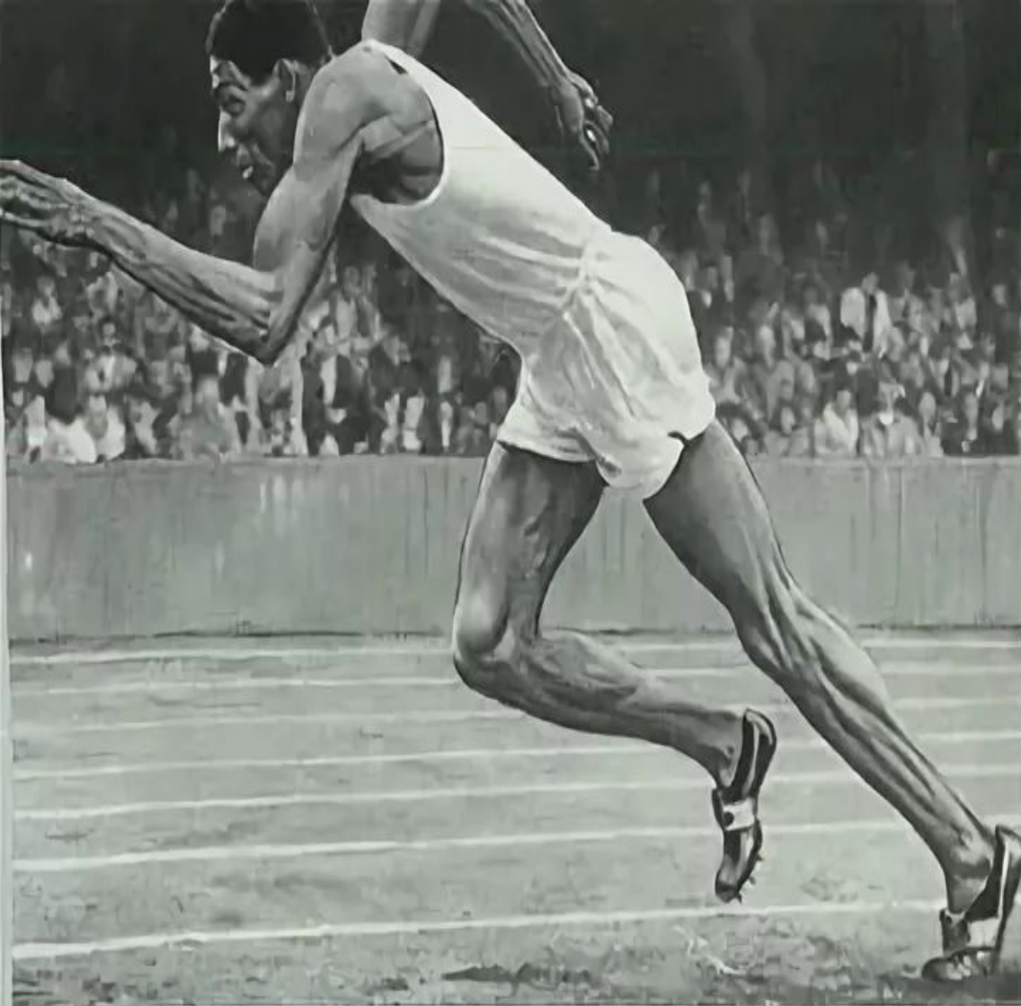
ARTHUR WINT (Jamaica), Olympic 400m. Champion. Time: 46.2 secs., equals Olympic record.