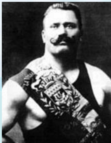
Иван Поддубный профессиональный борец и атлет