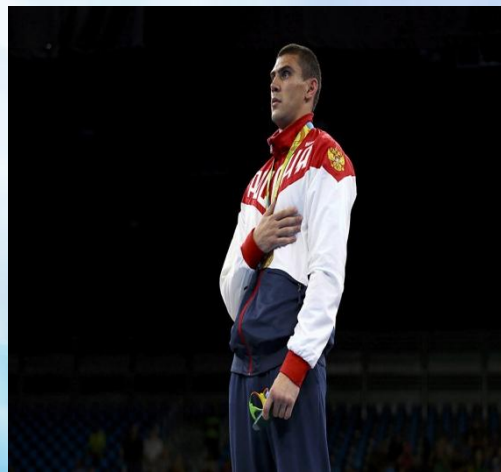
Евгений Тищенко Боксер Победитель Олимпийских игр в Рио-де-Жанейро