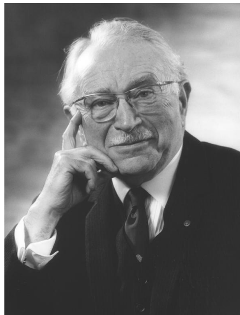
Людвиг Гуттман (3 июля 1899 - 18 марта 1980)

В 1976 году в Эрншёльдсвике (Швеция) состоялись первые зимние Паралимпийские игры, в которых впервые приняли участие не только колясочники, но и спортсмены с другими категориями инвалидности. В том же 1976 году летние Паралимпийские игры в Торонто вошли в историю, собрав 1600 участников из 40 стран