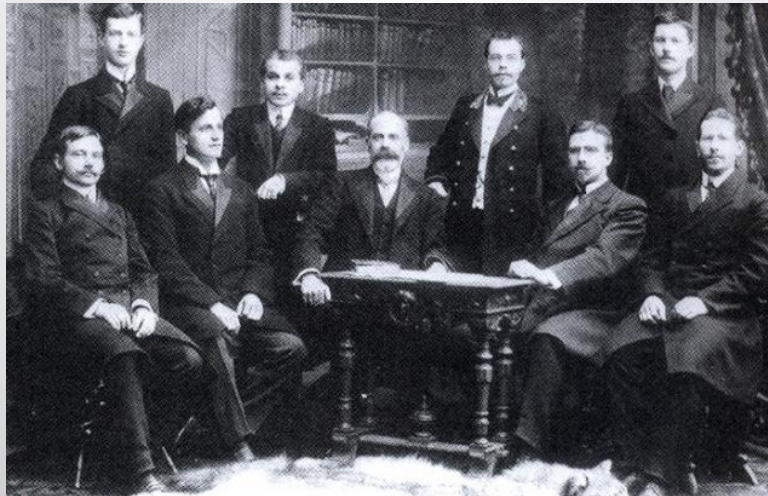
Заседание правления «Маяка»