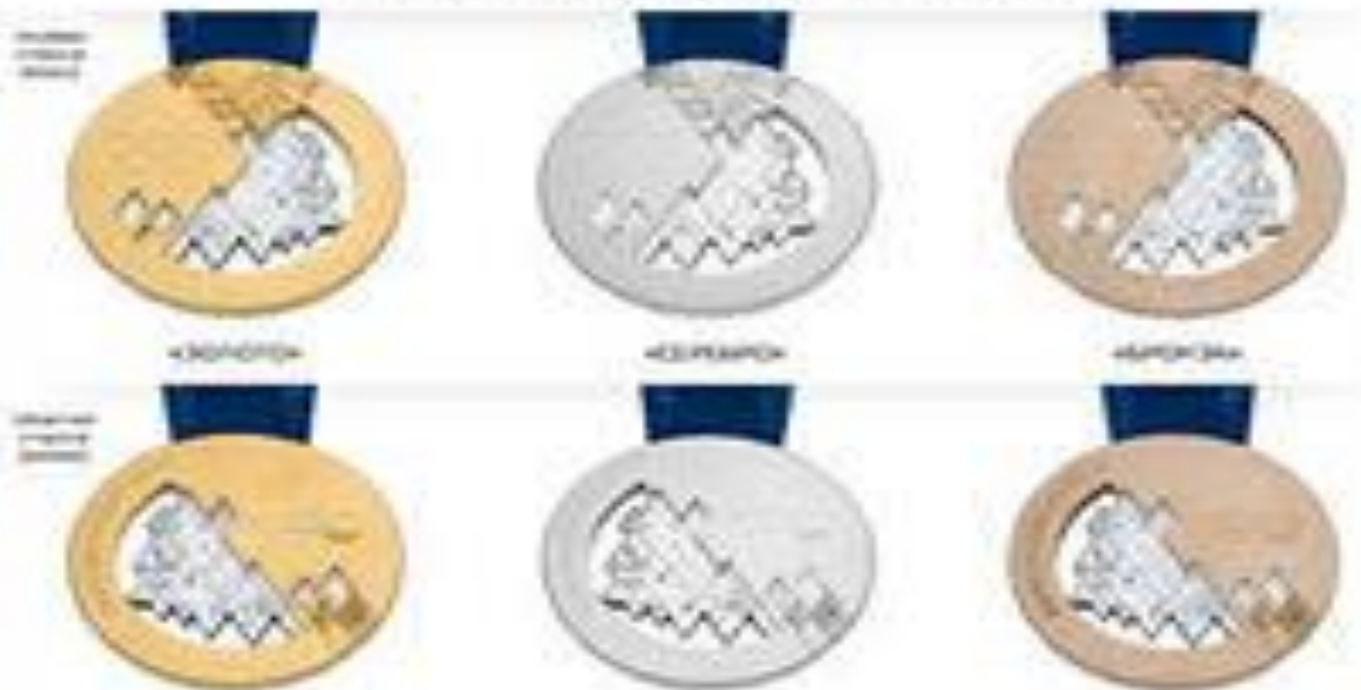
ОЛИМПИАДСКИЕ МЕДАЛИ «СОЧИ 2014»

XXII зимние Олимпийские игры в Сочи будут проходить с 6 по 23 февраля 2014 года. За 18 дней зимней Сочинской олимпиады будет разыграно 98 комплектов медалей.