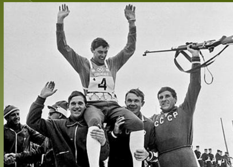
1968 год. Гренобль. Слева направо: Александр Тихонов, Владимир Гундарцев, Виктор Мамтов и Николай Пузанов

Игры–1968 в Гренобле стали удачными для биатлонистов. В эстафетной гонке принимали участие сразу три спортсмена: Александр Тихонов, Николай Пузанов и Владимир Гундарцев (все – уроженцы Челябинской области, но на Олимпиаде представляли другие регионы). Первый этап бежал Тихонов. Ему удалось заработать серьезный отрыв от команд-преследователей – более двух минут. Вторым стартовал Пузанов, а Гундарцев вышел на дистанцию последним и закрепил преимущество товарищей по команде. В результате в копилке сборной СССР оказалась золотая олимпийская медаль. Но «золото» в эстафете стало не единственной наградой для Тихонова и Гундарцева. Оба спортсмена стартовали в индивидуальной гонке на 20 километров. На дистанции развернулась ожесточенная борьба, в результате которой Тихонов и Гундарцев заняли второе и третье места соответственно , уступив только норвежцу Магнару Сольбергу.