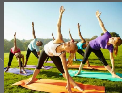
Занятия физ. упр.