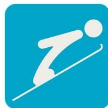
Прыжки с трамплина