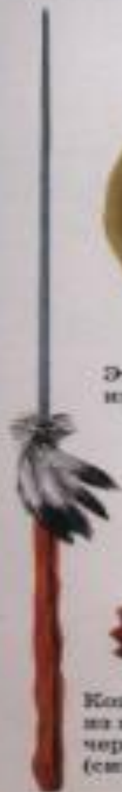
Копье воина из племени черноногих (сикиксов).