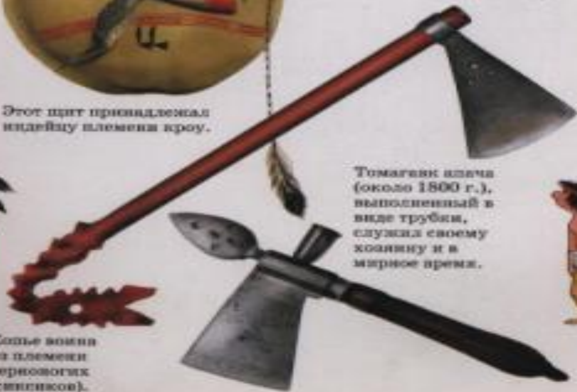
Боевой топор индейца племени оседжи.