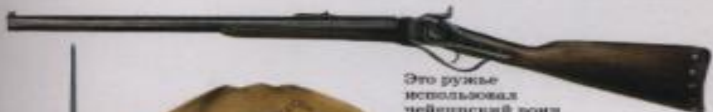
Это ружье использовал чейеннский воин около 1830 г.