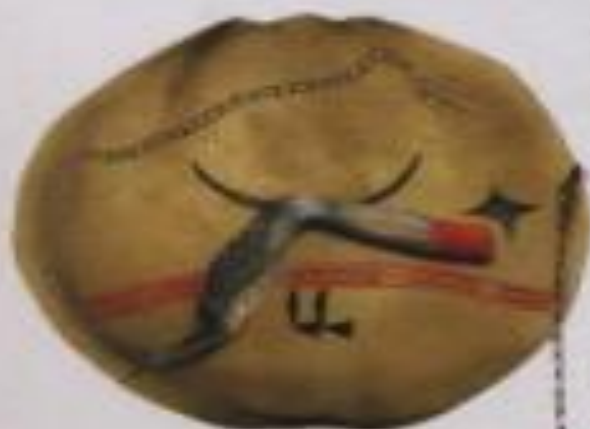
Этот щит принадлежал индейцу племени кроу.