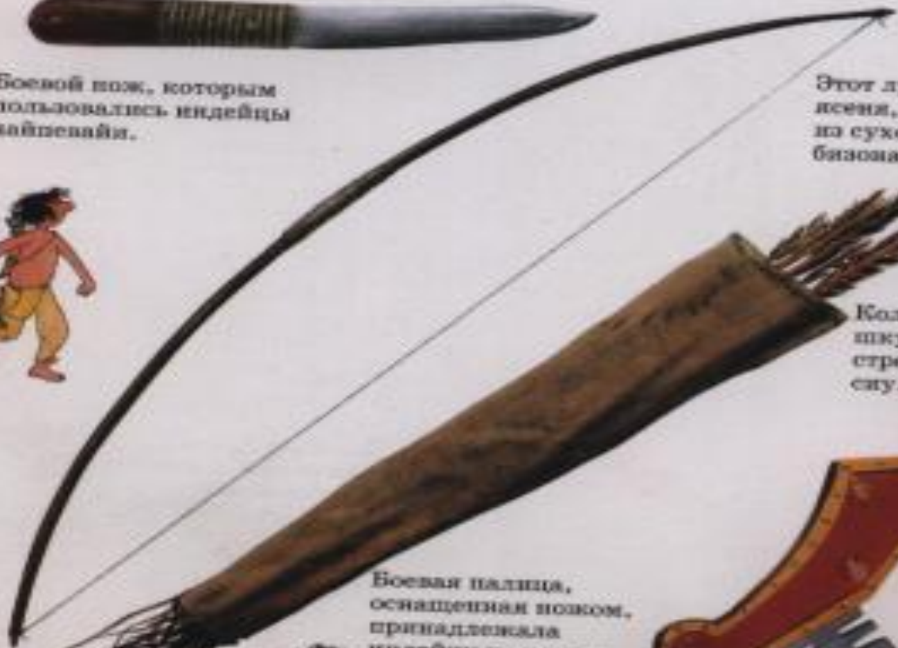
Колчан из шкуры оленя и стрелы индейца сиу.