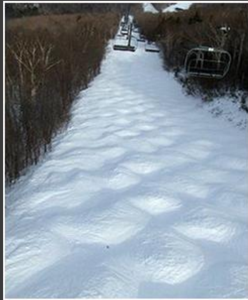
Поле естественных бугров