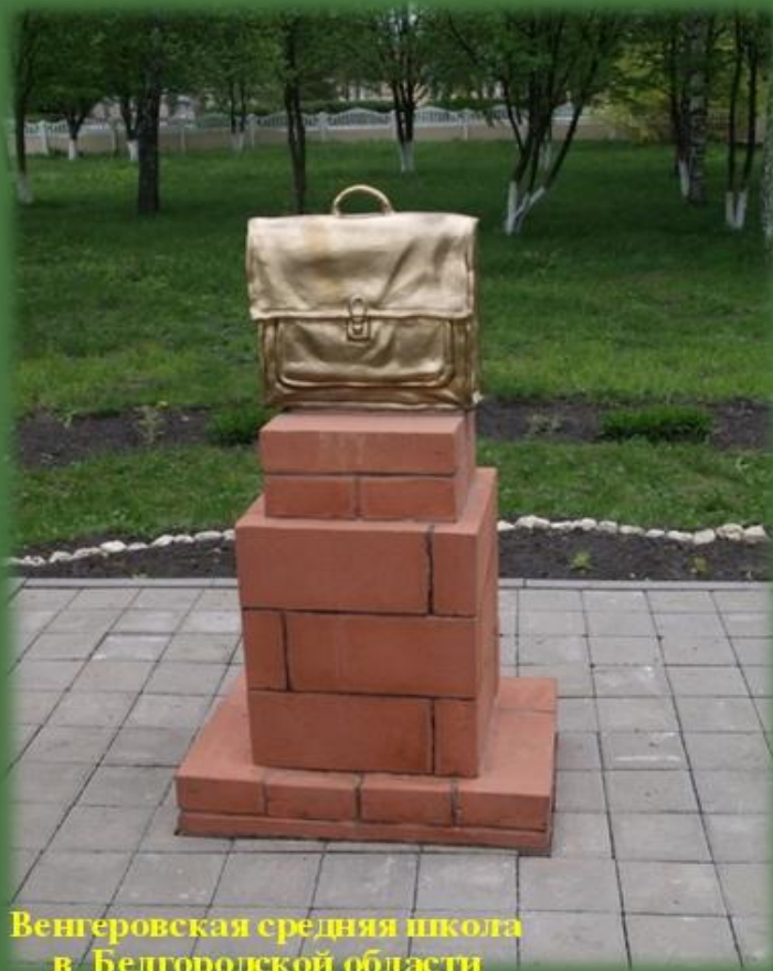
Венгеровская средняя школа в Белгородской области Автор скульптурной композиции А.Н. Беликов

Памятник простому школьному портфелю установлен в Белгородской области