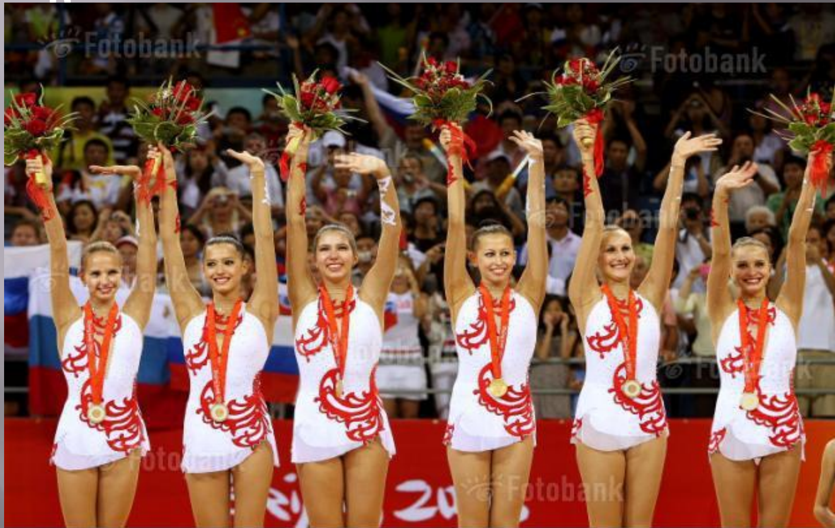
WWW.FOTOBANK.RU G500-6618 Getty Images Sport EO Российские золотые медалисты Олимпийских игр-2008, Пекин, Китай, август 2008.

В России художественная гимнастика небезосновательно считается одним из популярнейших видов спорта.