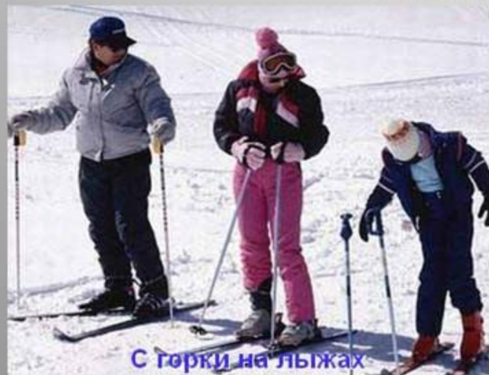
С горки на лыжах