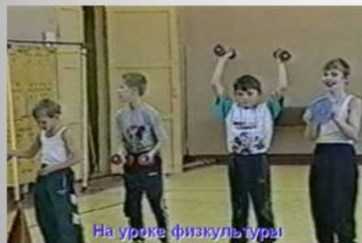
На уроке физкультуры