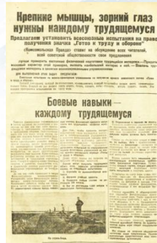
Газета «Комсомольская Правда»,