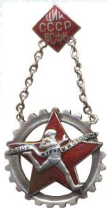
Знак ГТО 1931-1936 годов (1 ступень)