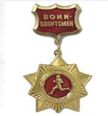
Золотой нагрудный знак «Воин-спортсмен», 1961 год