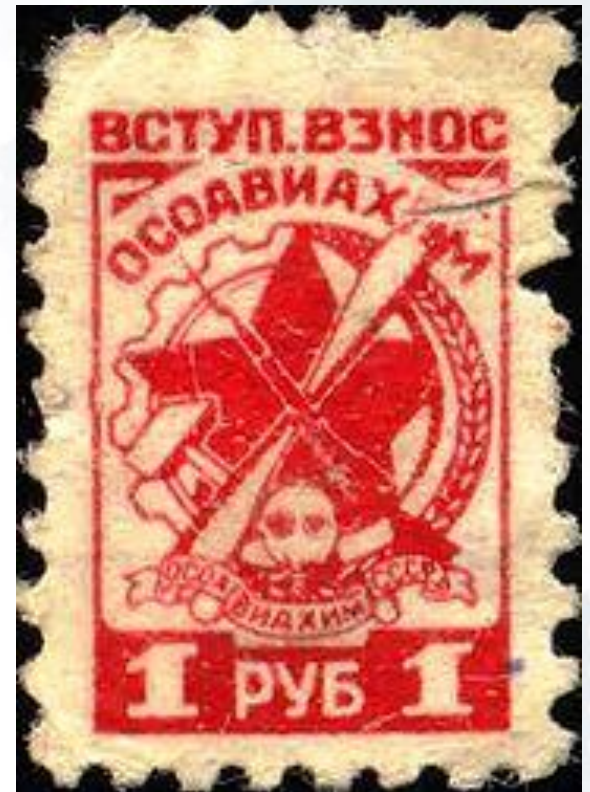
Марка с логотипом ОСОАВИАХИМ