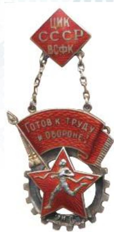
Знак ГТО 1931-1936 годов (2 ступень)