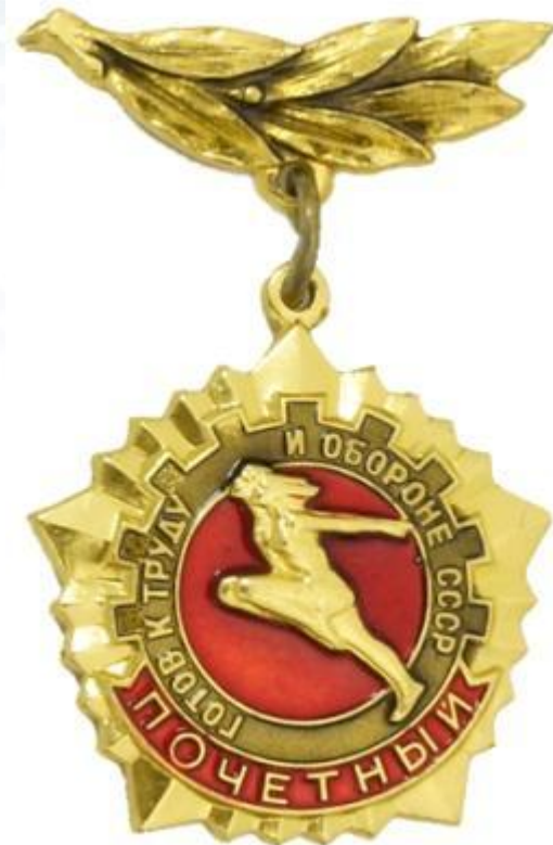
Почетный знак ГТО