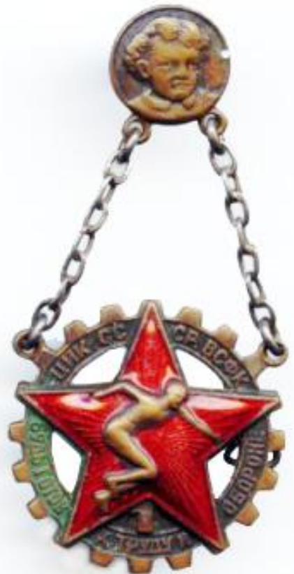
Знак БГТО образца 1934 года