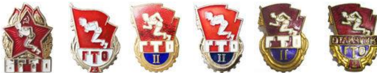
Знаки БГТО и ГТО