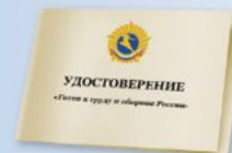
UD6 Размер: 70х100 мм Плотная бумага