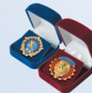
FU125a (бордо) FU125b (синий) Внут. размер: 45х42 мм

ПОДЛОЖКА В УПАКОВКЕ ДЛЯ ЗНАКОВ «ГОТОВ К ТРУДУ И ОБОРОНЕ»