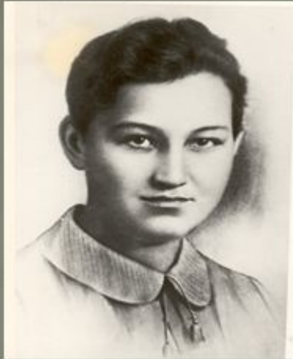
Зоя Космодемьянская 1923-1941