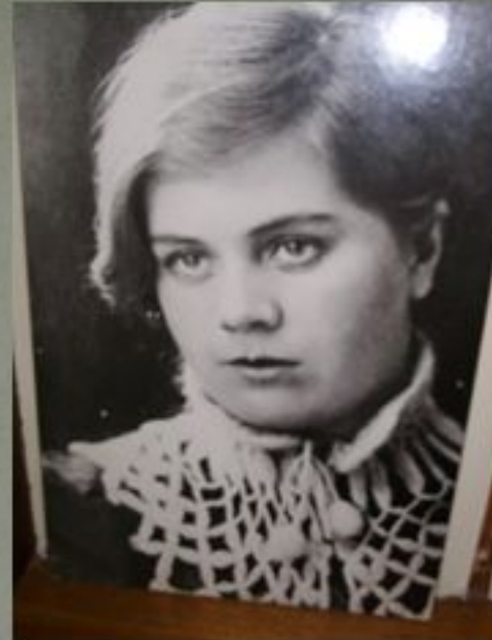
Вера Волошина 1919-1941