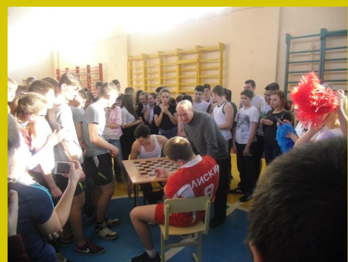
Соревнования по армреслингу