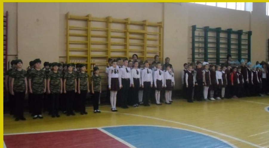
Смотр строя и песни