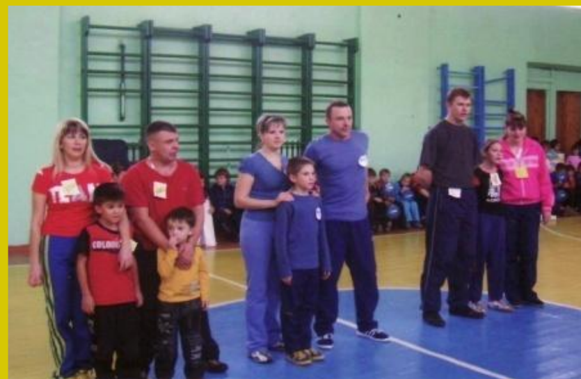
Папа, мама, я – спортивная семья