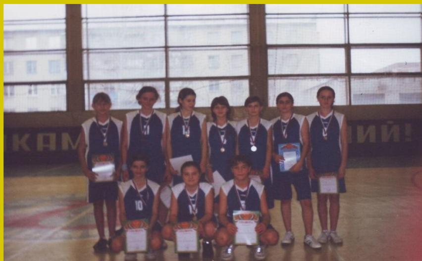
Школьная сборная по баскетболу