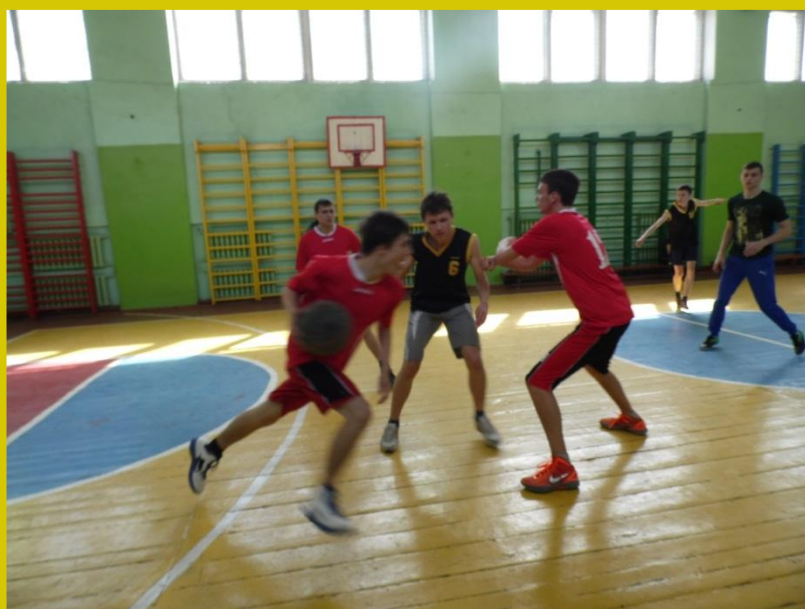
Товарищеская встреча по баскетболу