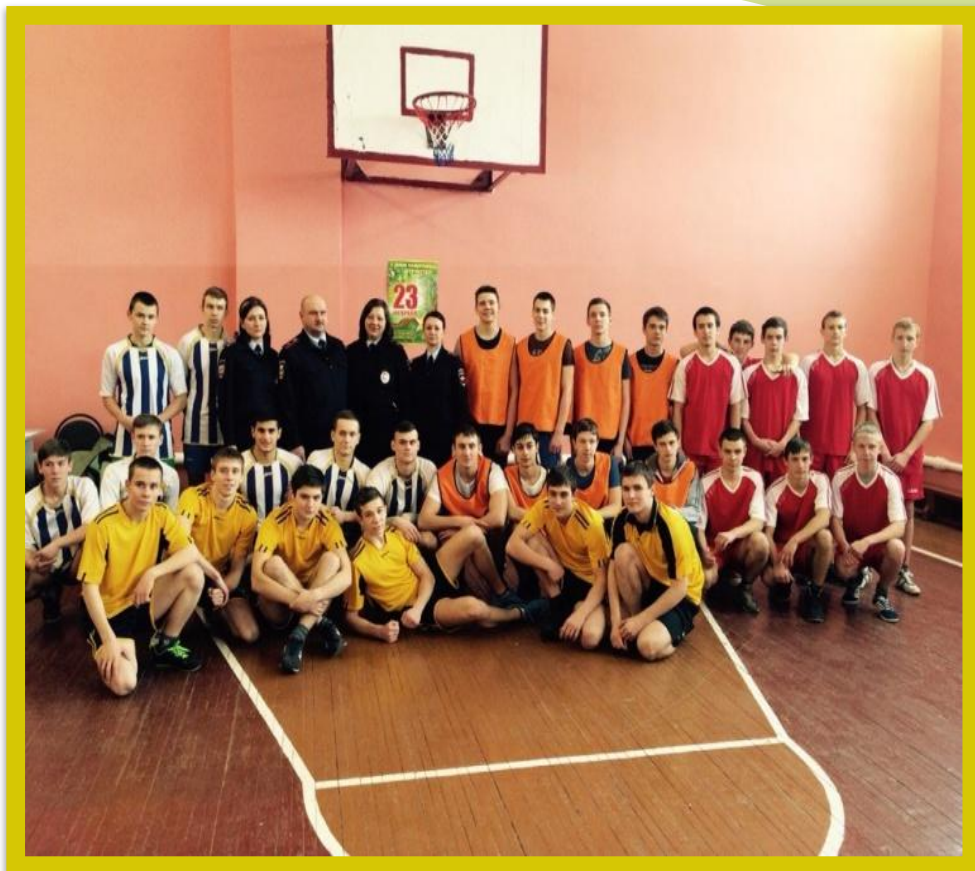
Соревнования по минифутболу