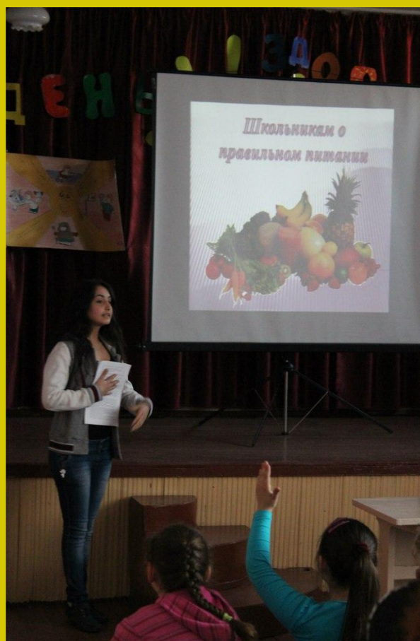
Пропаганда правильного питания