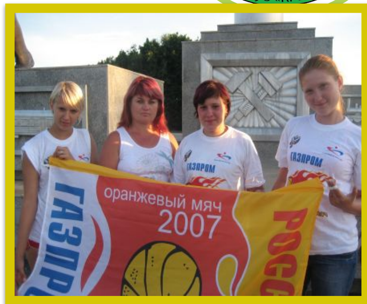
Ежегодные соревнования «Оранжевый мяч»