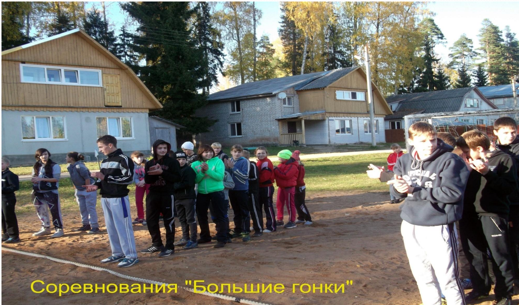
Соревнования "Большие гонки"