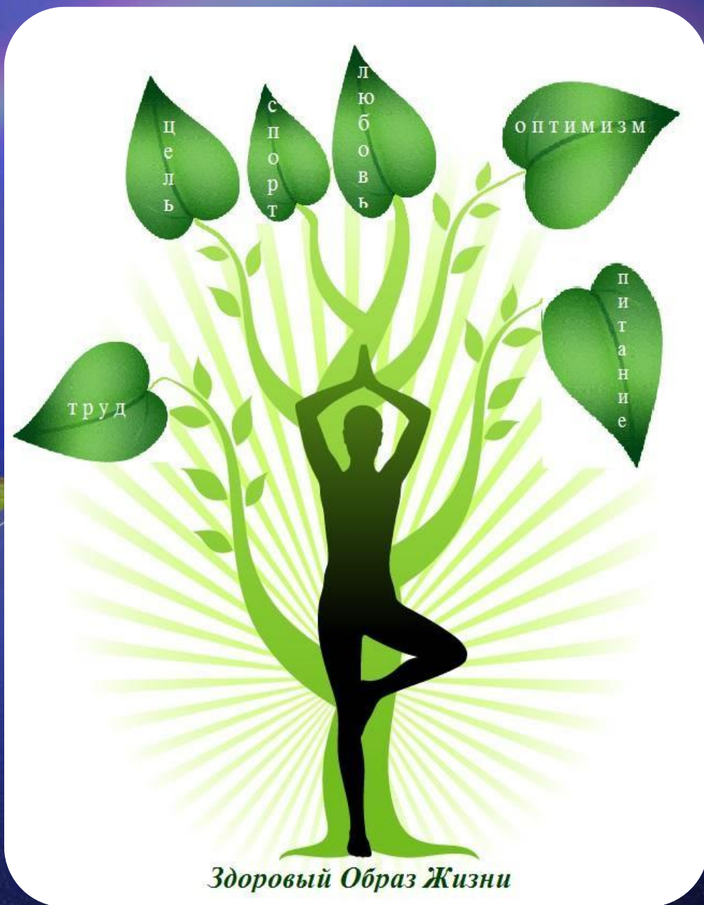
Здоровый Образ Жизни