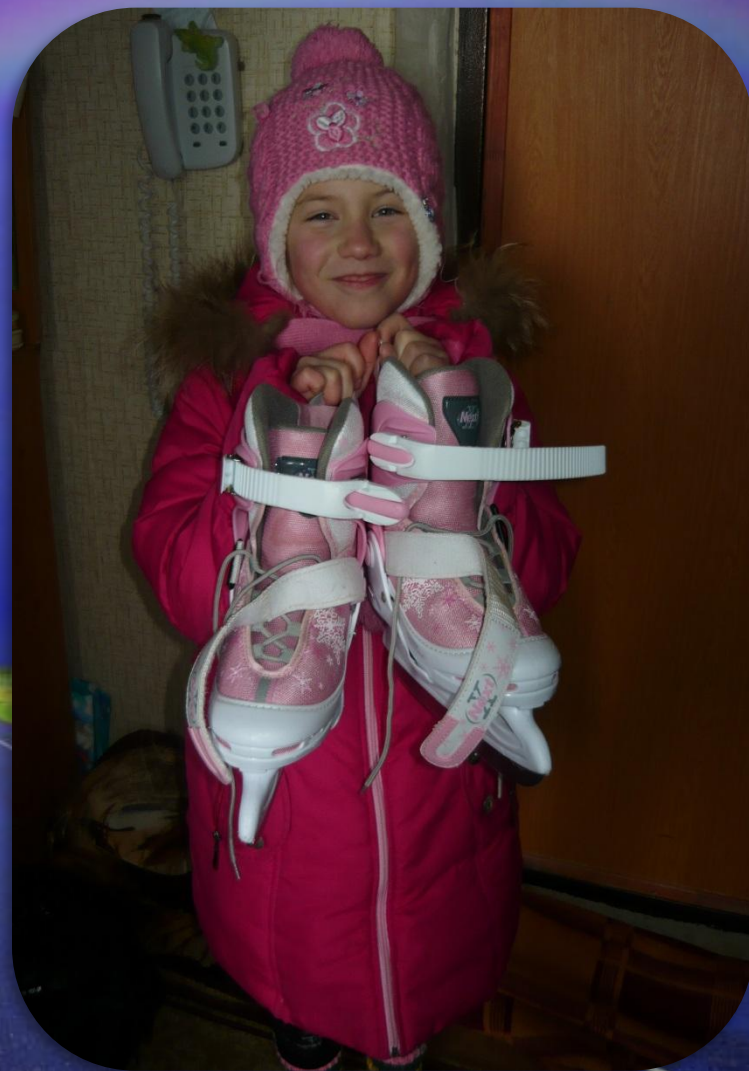
Мои первые коньки. 2012 год