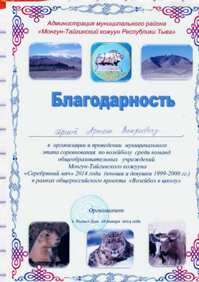
Благодарность Администрации муниципального района, 2014 г.