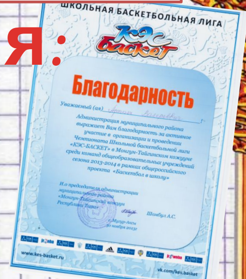
Благодарность председателя администрации Монгун- Тайгинского кожууна Республики Тыва, 2013 г.