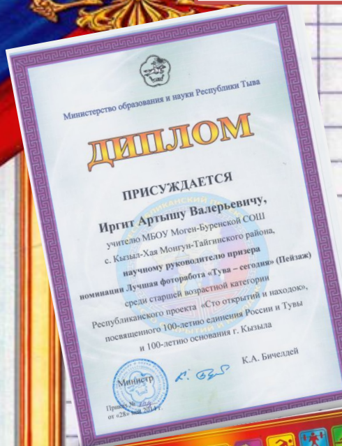
Диплом Министерство образования и науки Республики Тыва, 2014 г.