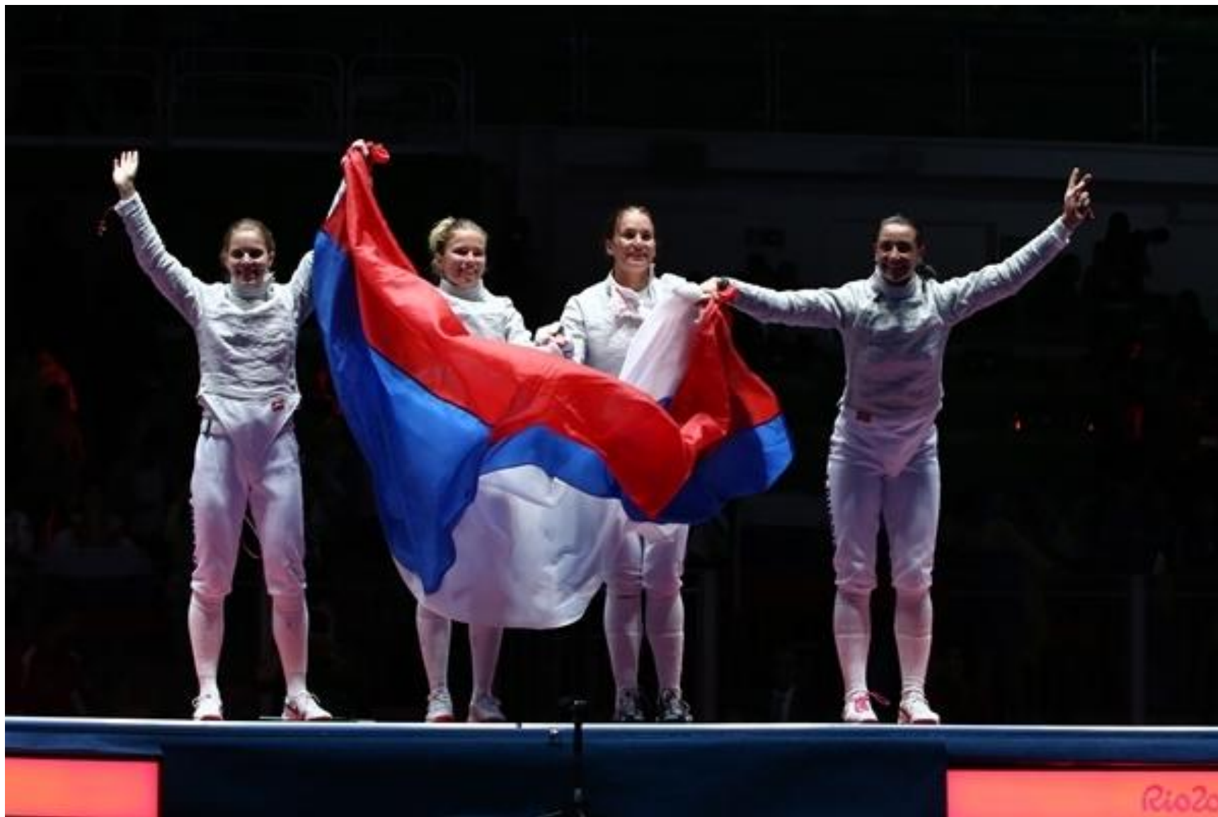
Сборная России по фехтованию