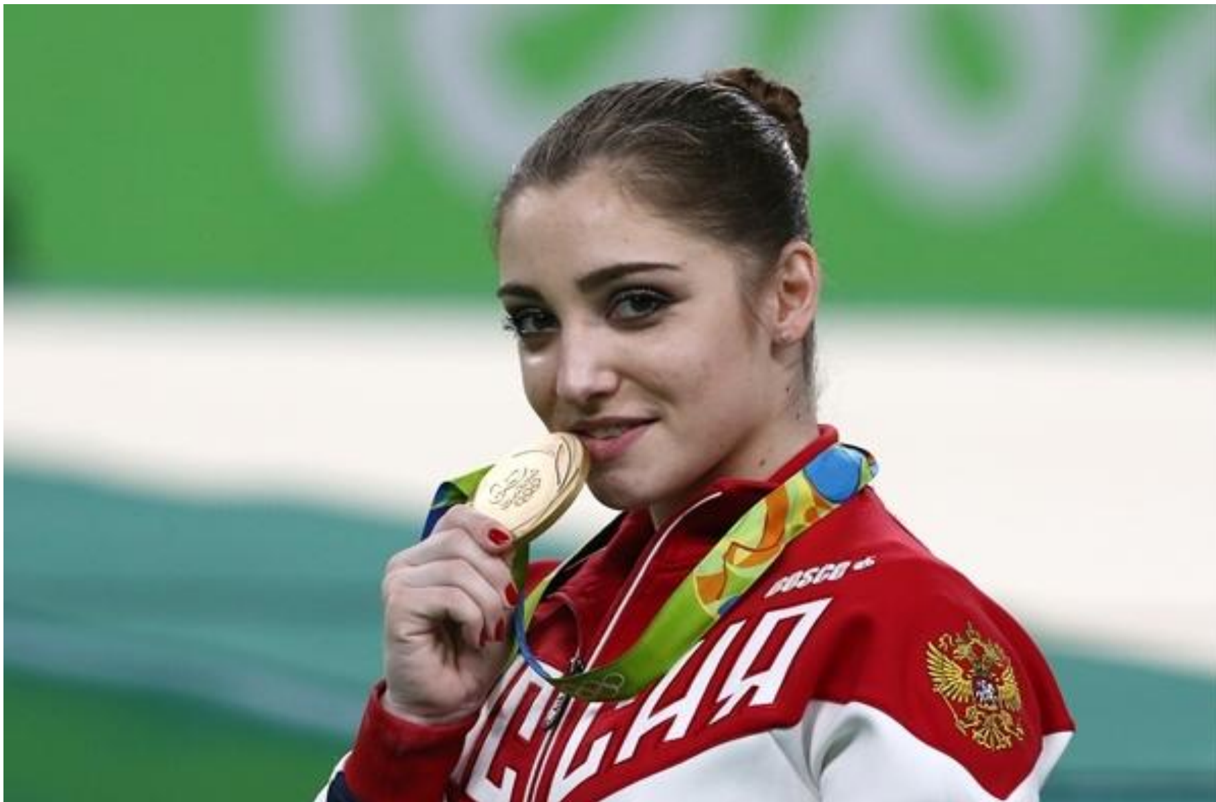
Алия Мустафина, спортивная гимнастика