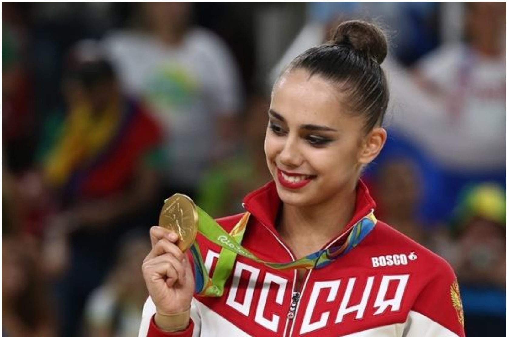
Маргарита Мамун, художественная гимнастика