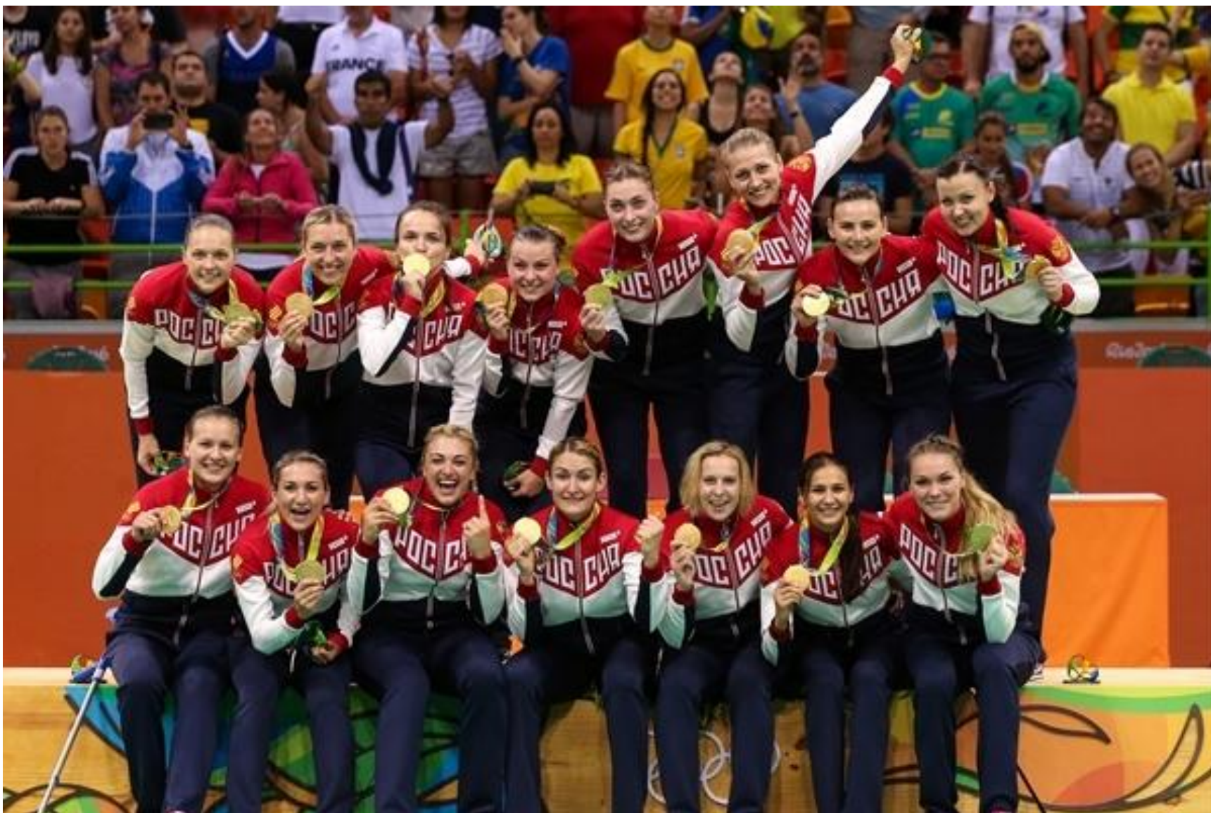
Сборная России по гандболу