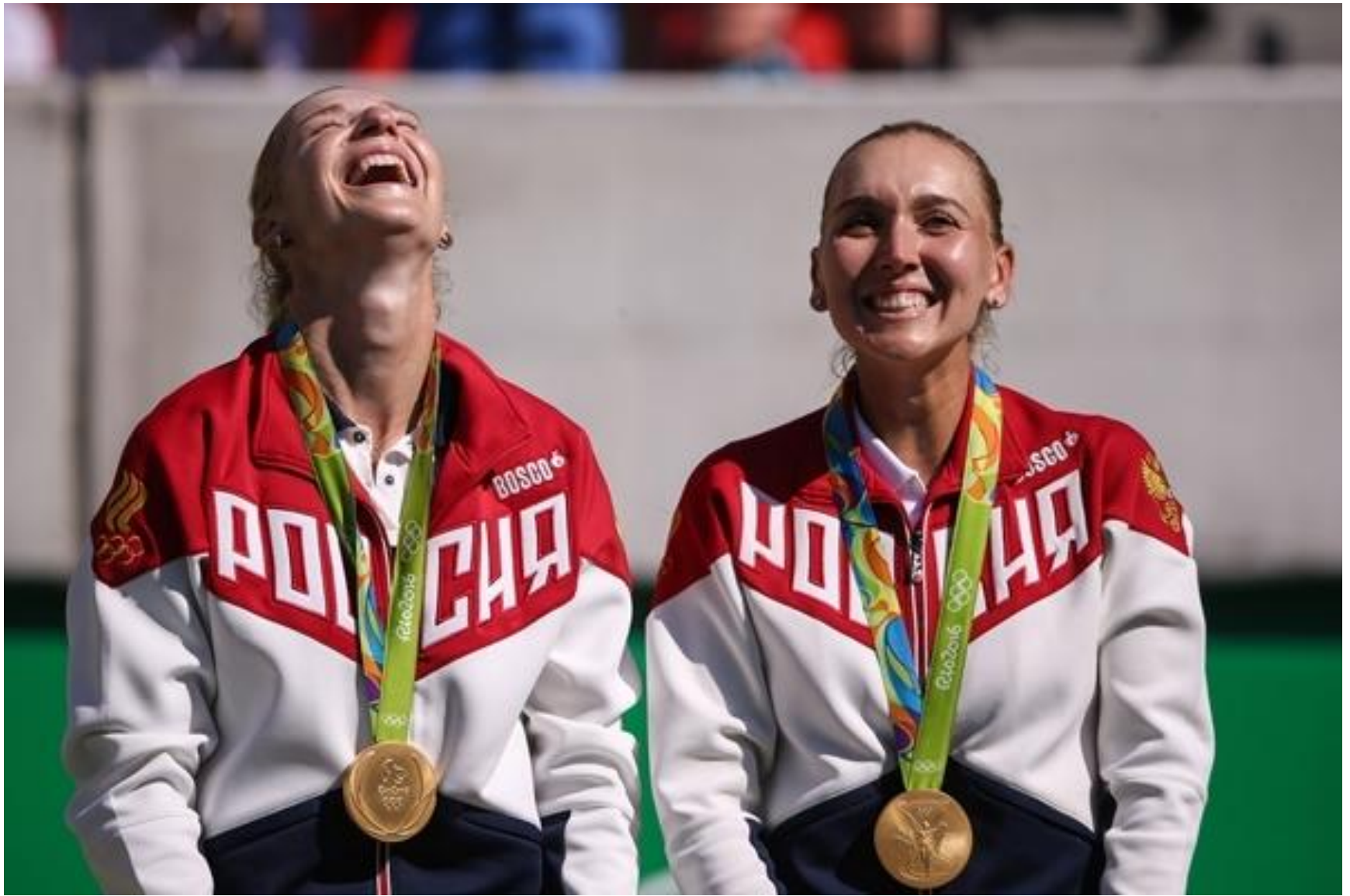
Екатерина Макарова и Елена Веснина, теннис