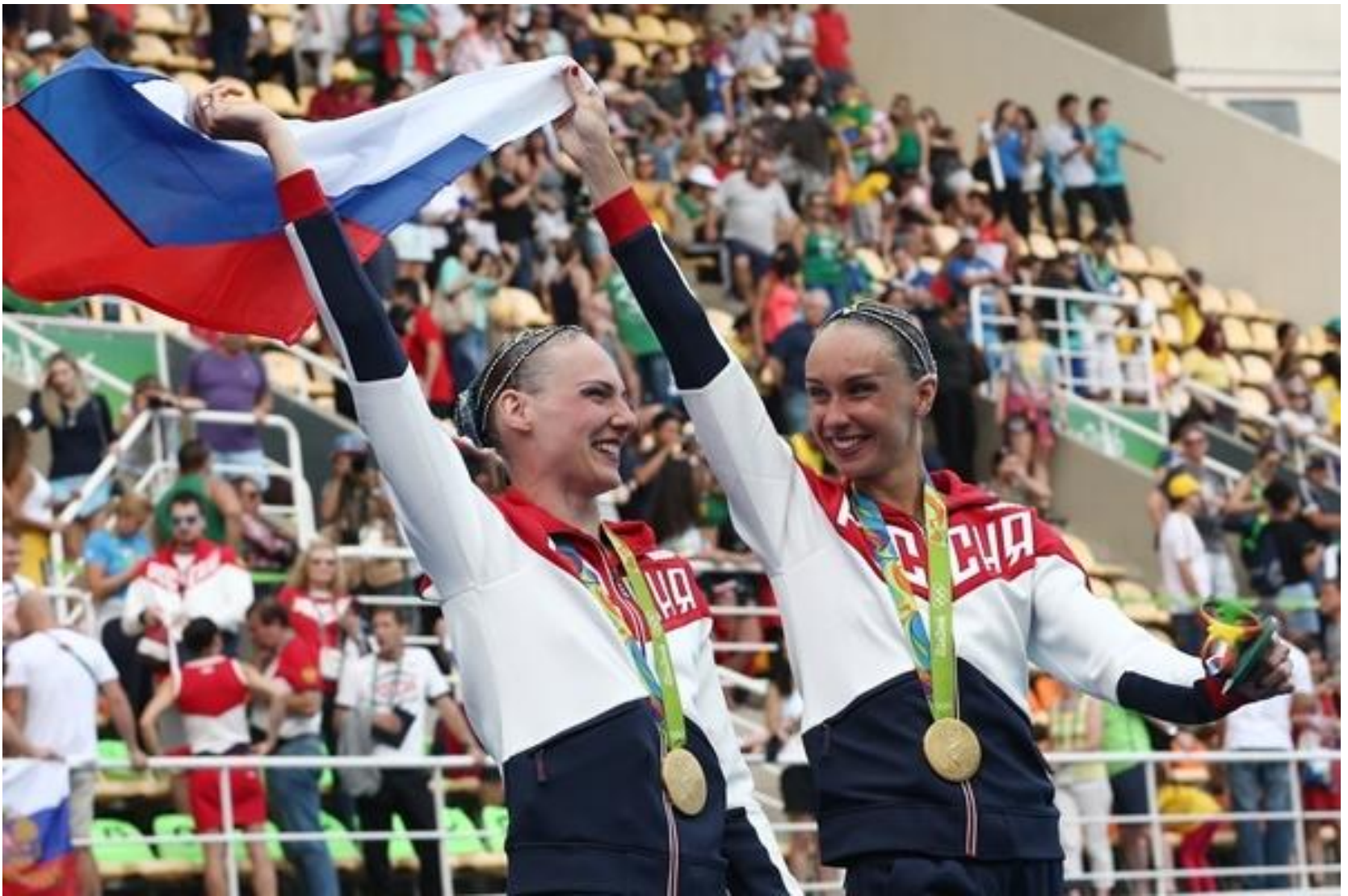
Наталья Ищенко и Светлана Ромашина, синхронное плавание