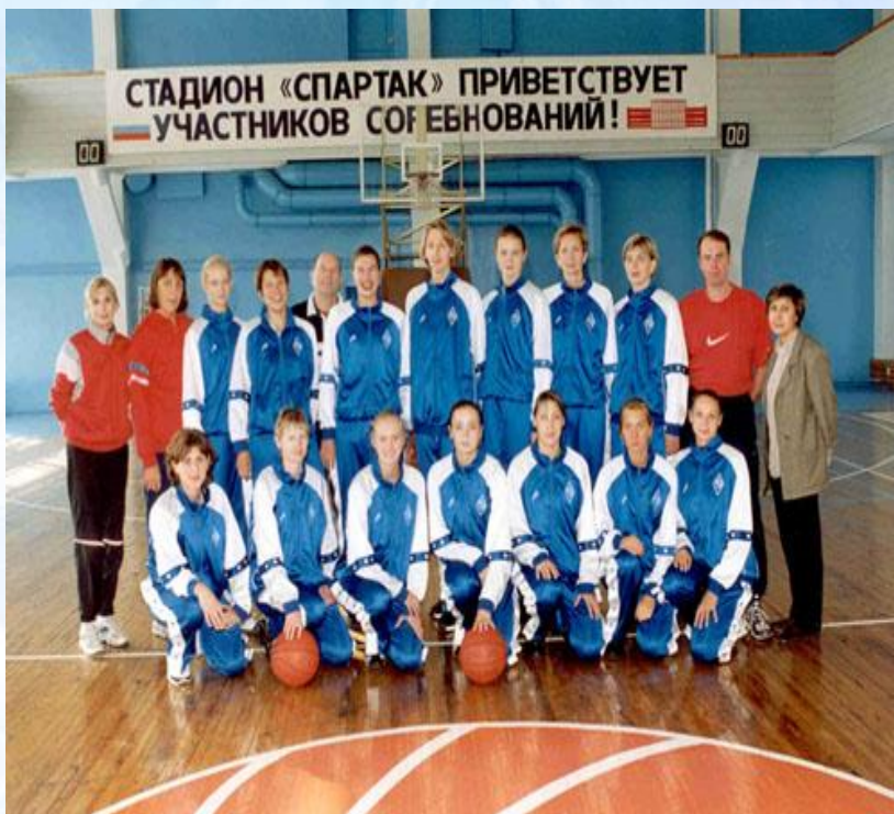
"Динамо-Энергия" (Новосибирск) 2002 года.