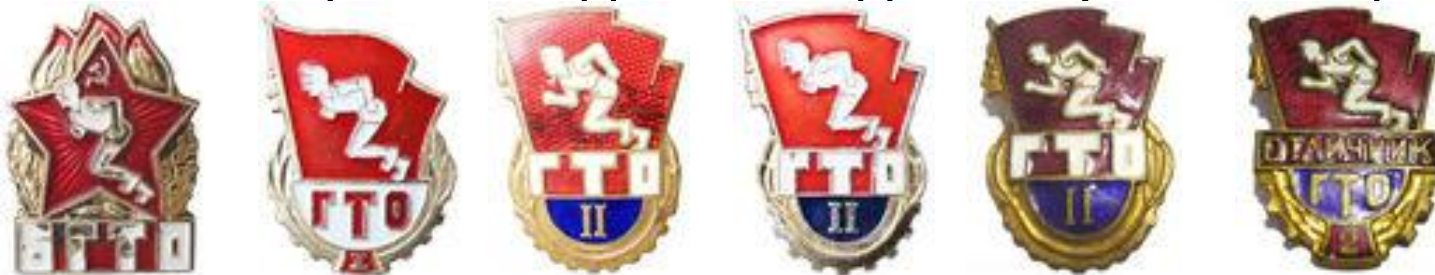
Знаки БГТО и ГТО 1961 года