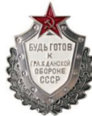
Знаки «Готов к защите Родины»