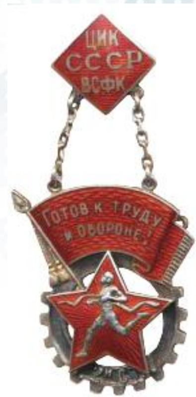
Знак ГТО 1931-1936 годов (2 степень)