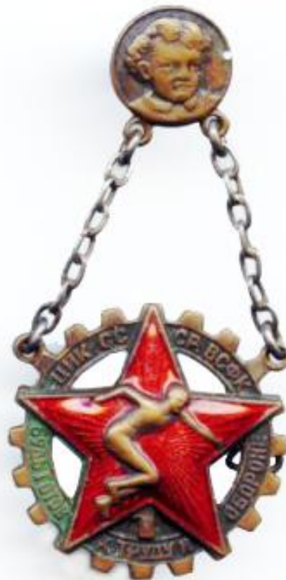
Знак БГТО образца 1934 года