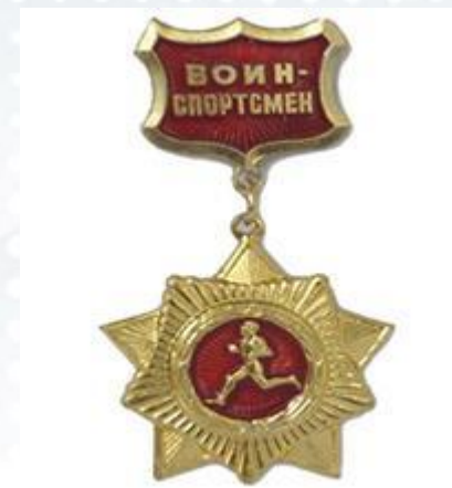
Золотой нагрудный знак «Воин-спортсмен», 1961 год