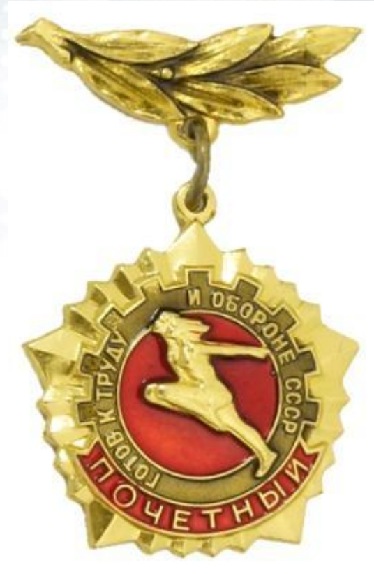
Почетный знак ГТО