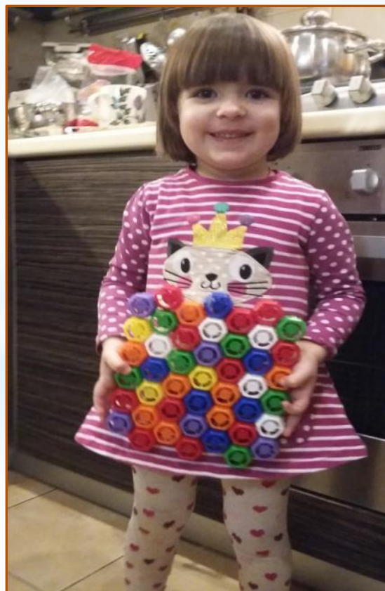
А вот у семьи Гусячкиных из пробок из-под детского питания получился занимательный массажер «Разноцветные цветочки»