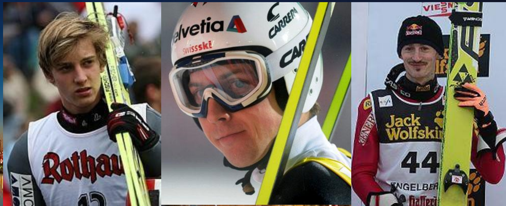
А. Грегор Шлиренцауэр В. Симон Амман С. Адам Малыш