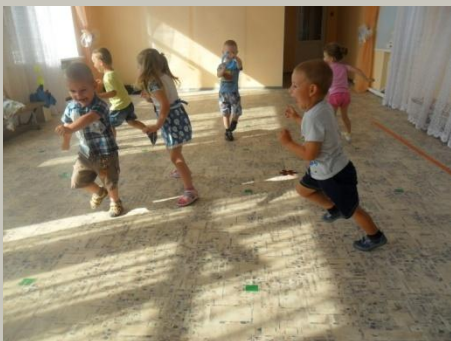
«Воробушк и и