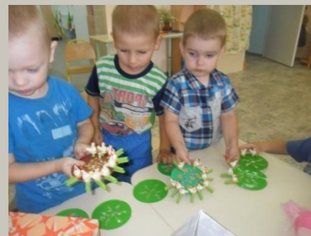
«Вышла курочка гулять»