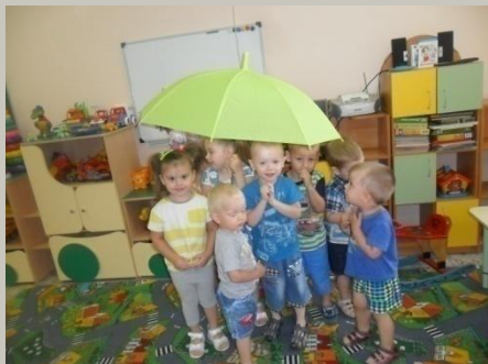
«Солнышко и дождик»