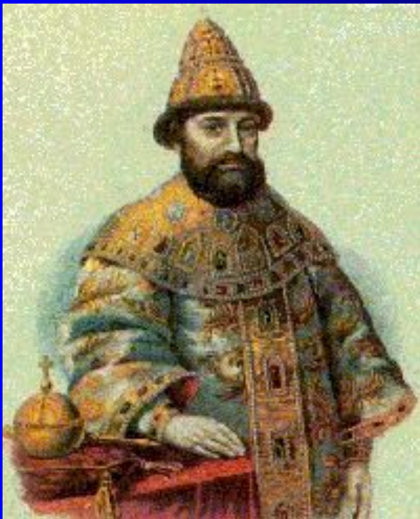
Михаил Федорович Романов