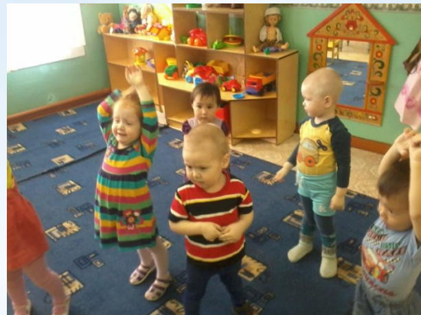
Утренняя зарядка под музыку