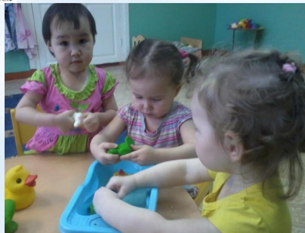
Игры с водой