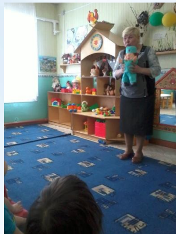
Встреча с Айболитом

Совместная деятельность воспитателя и детей.