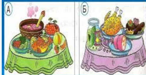
Рассматривание плаката и беседа о полезной пище