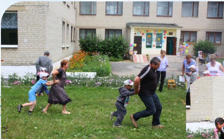
Эстафеты с родителями