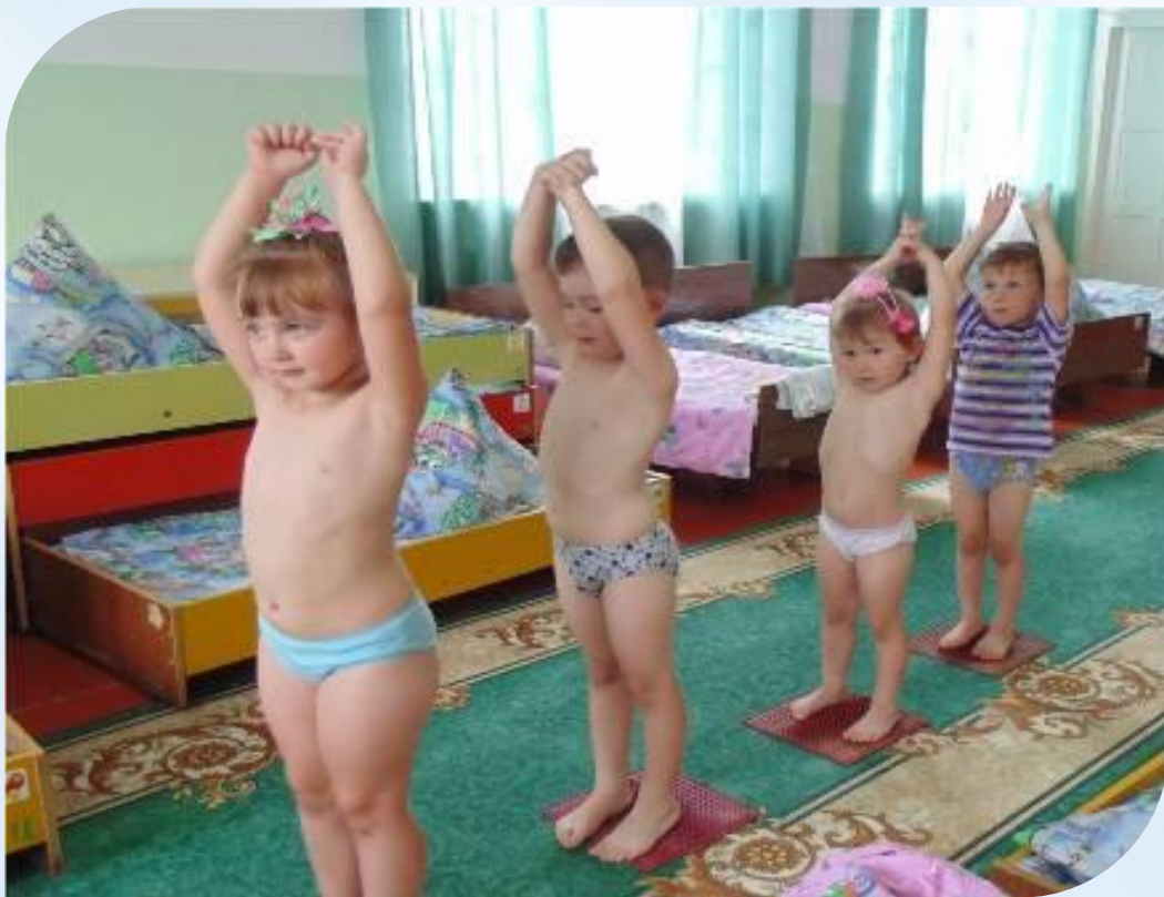
Гимнастика после сна