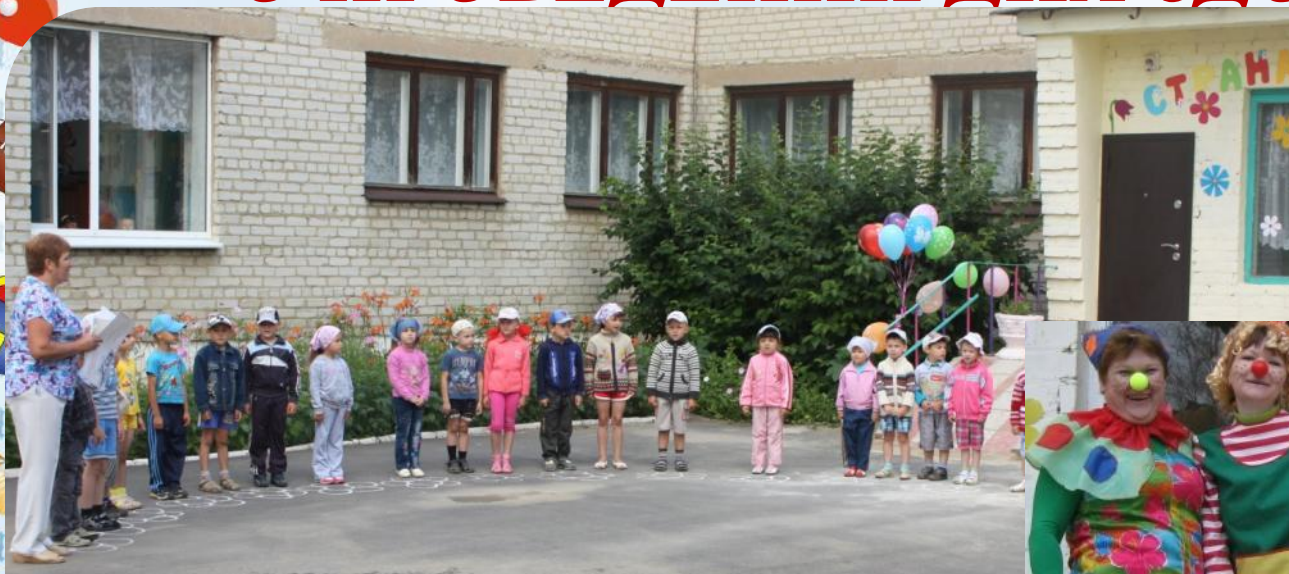
Торжественное открытие Дня здоровья