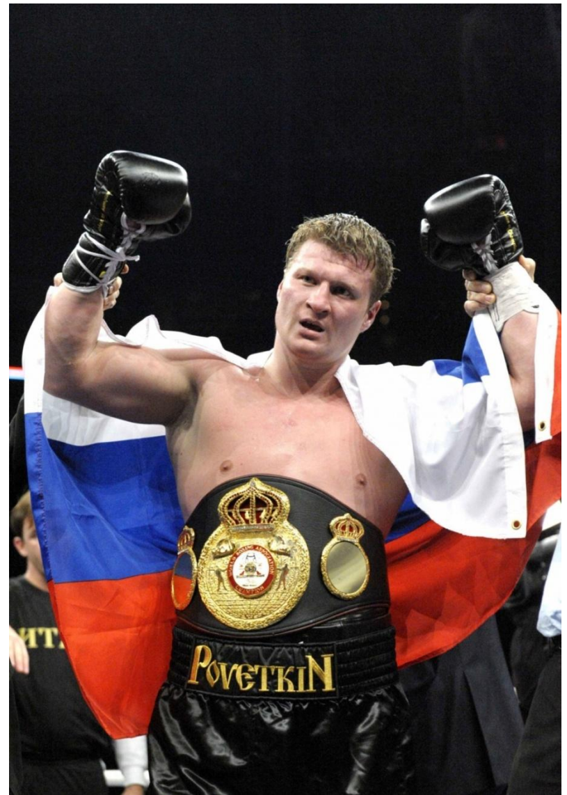
Поветкин Александр Владимирович Бокс