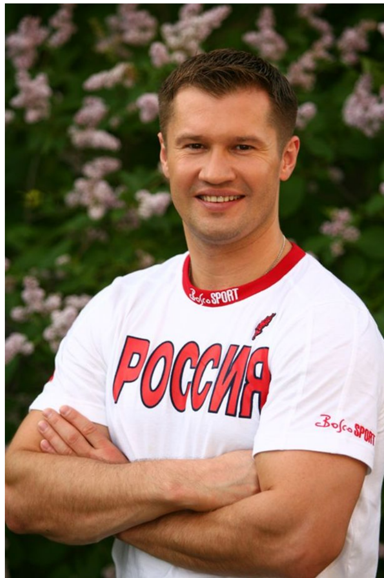
Немов Алексей Юрьевич Спортивная гимнастика