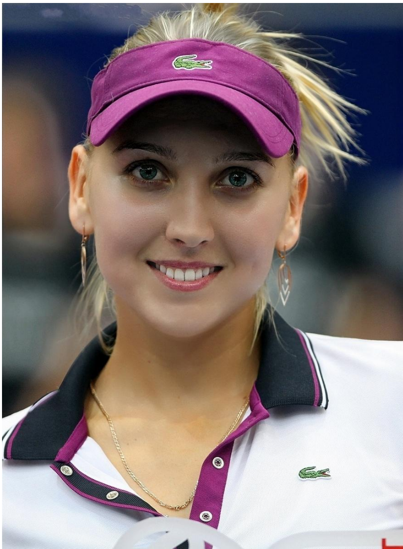
Веснина Елена Сергеевна Теннис