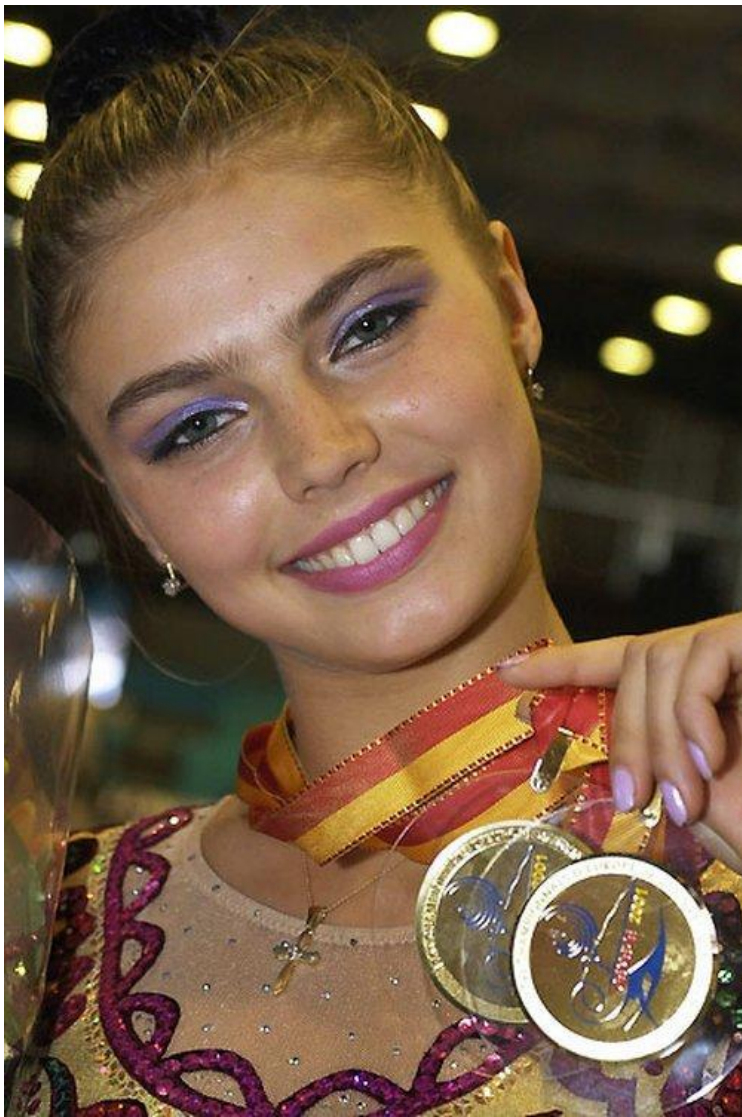
Кабаева Алина Маратовна Художественная гимнастика