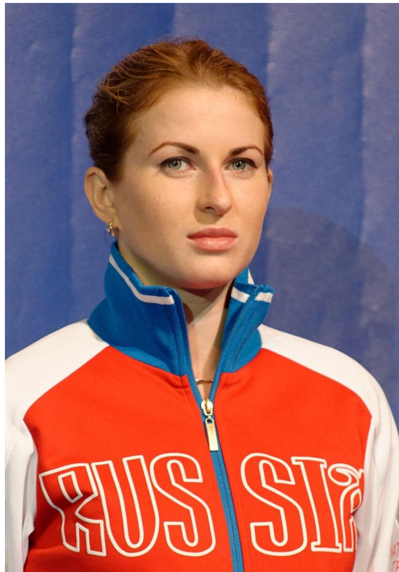
Дериглазова Инна Васильевна Фехтование