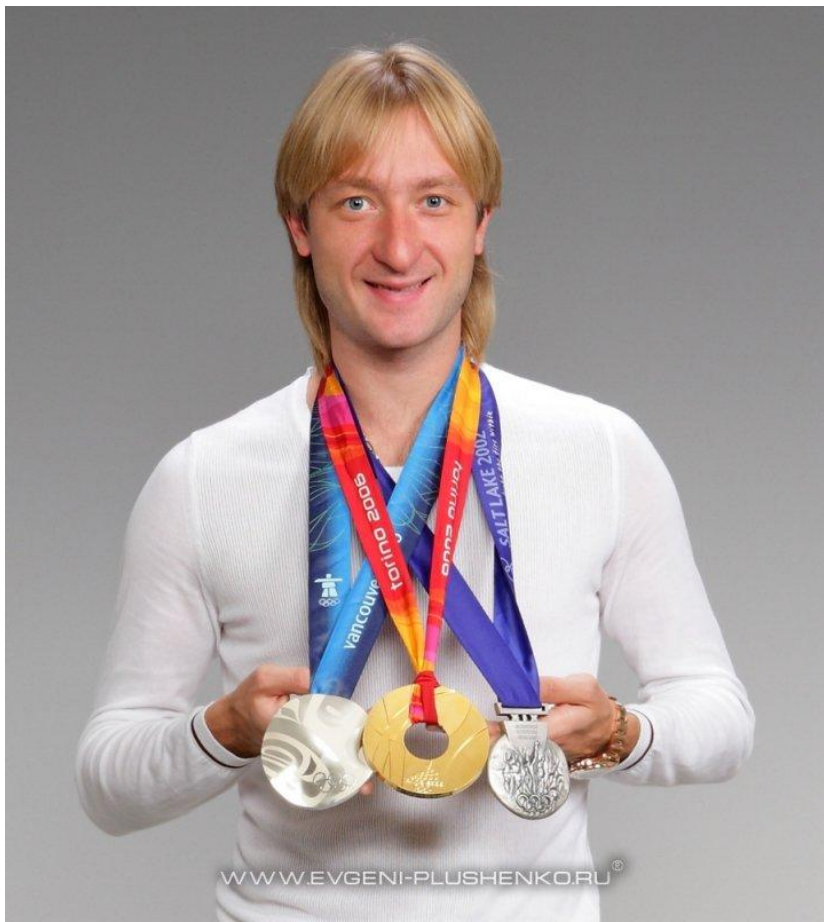
Плющенко Евгений Викторович Фигурное катание