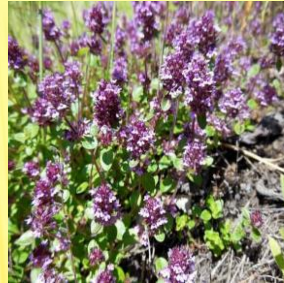
Душица или Чабрец