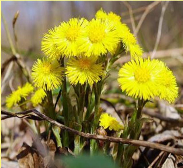
Мать – и – мачеха