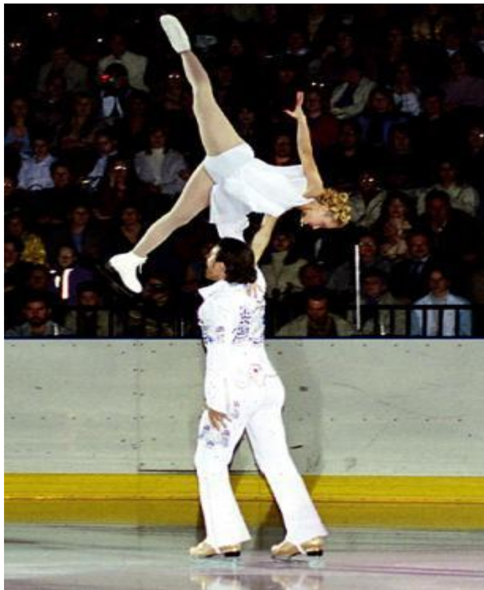
ФИГУРНОЕ КАТАНИЕ парное