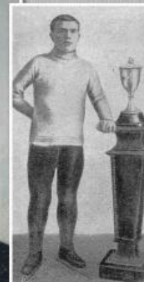
Чемпион России 1915 года Я. Мельников с кубком.