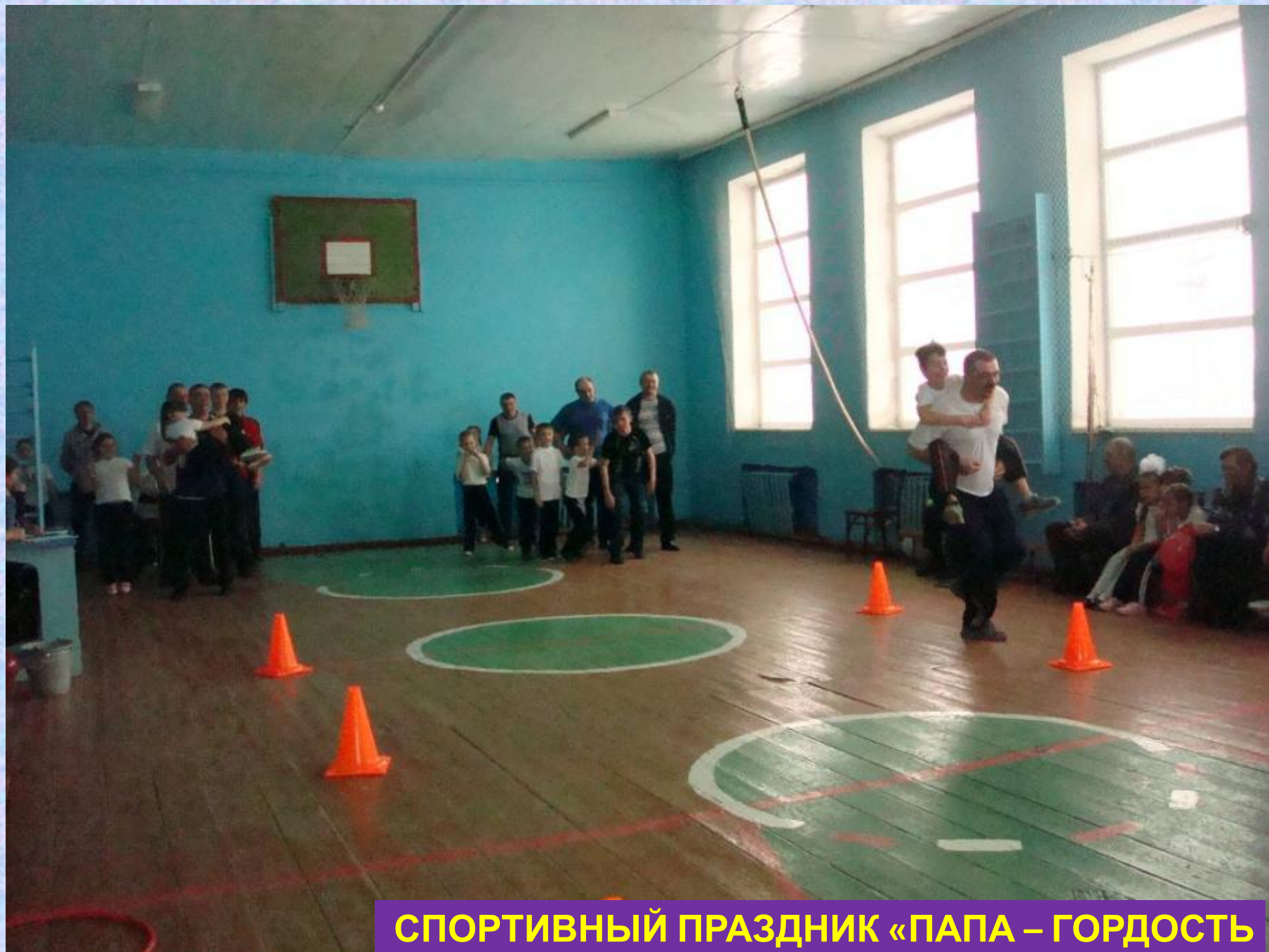
СПОРТИВНЫЙ ПРАЗДНИК «ПАПА – ГОРДОСТЬ МОЯ!»