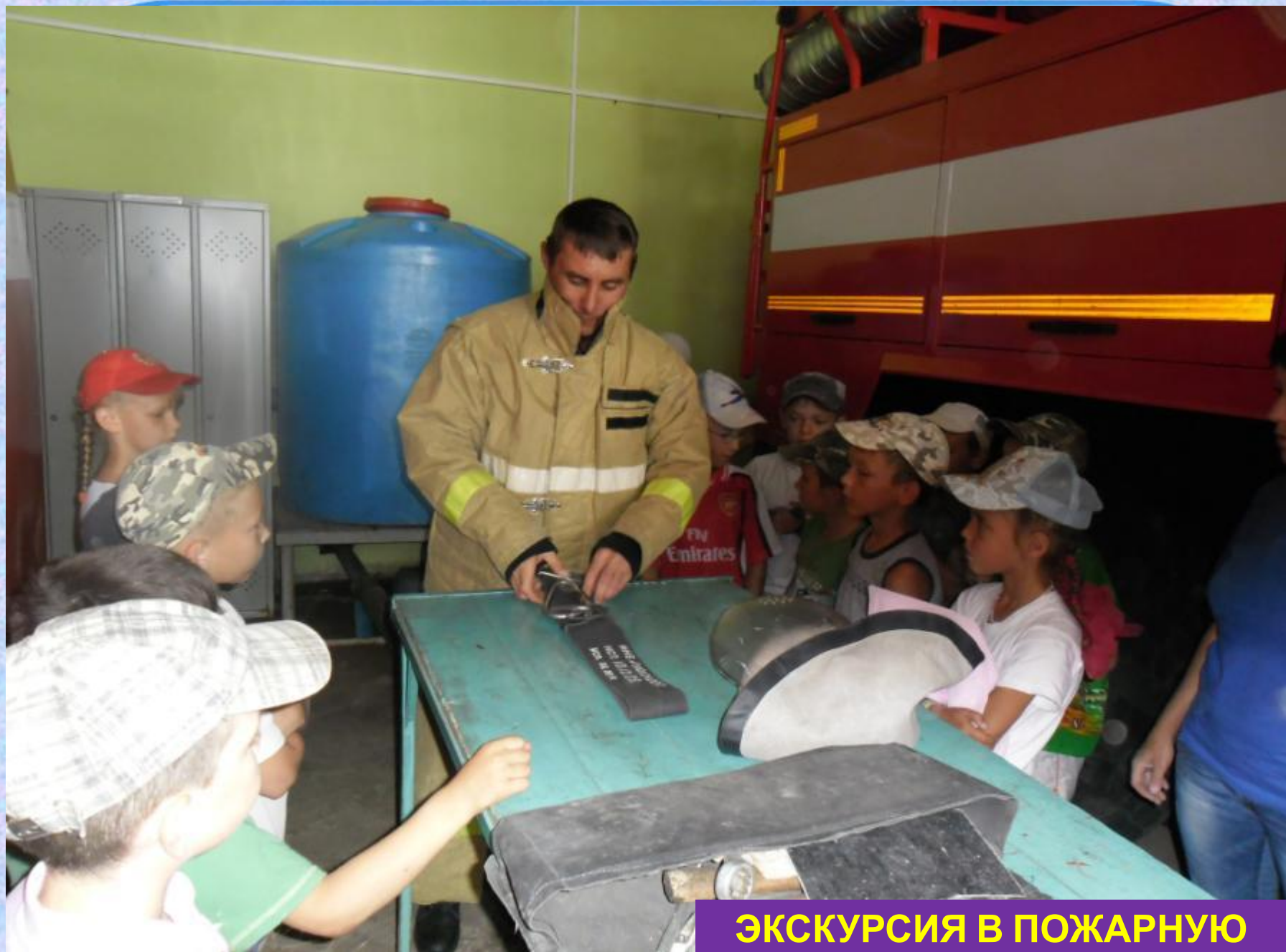
ЭКСКУРСИЯ В ПОЖАРНУЮ ЧАСТЬ