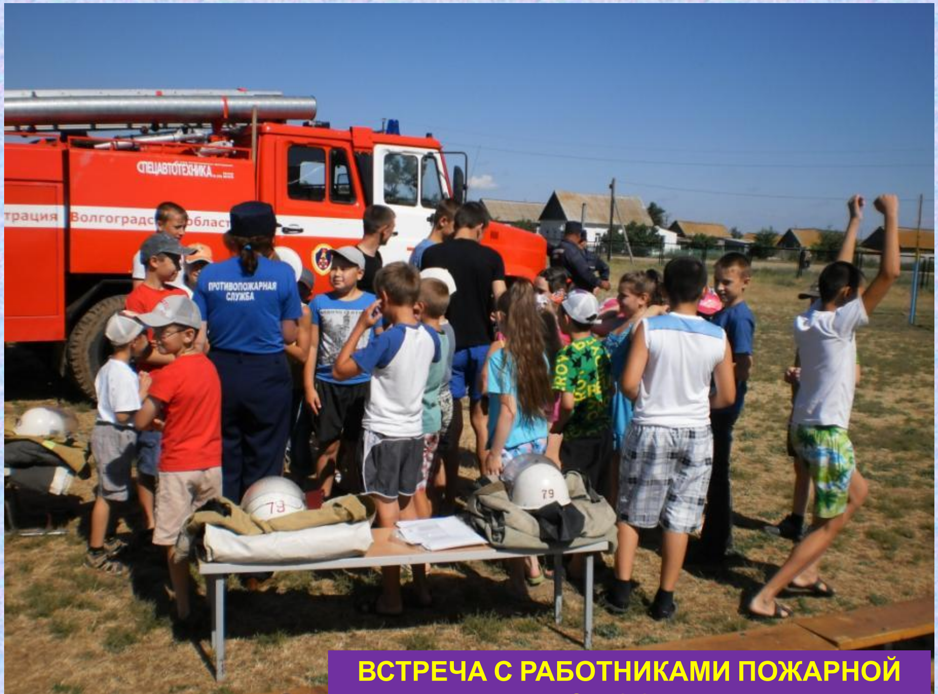
ВСТРЕЧА С РАБОТНИКАМИ ПОЖАРНОЙ СЛУЖБЫ