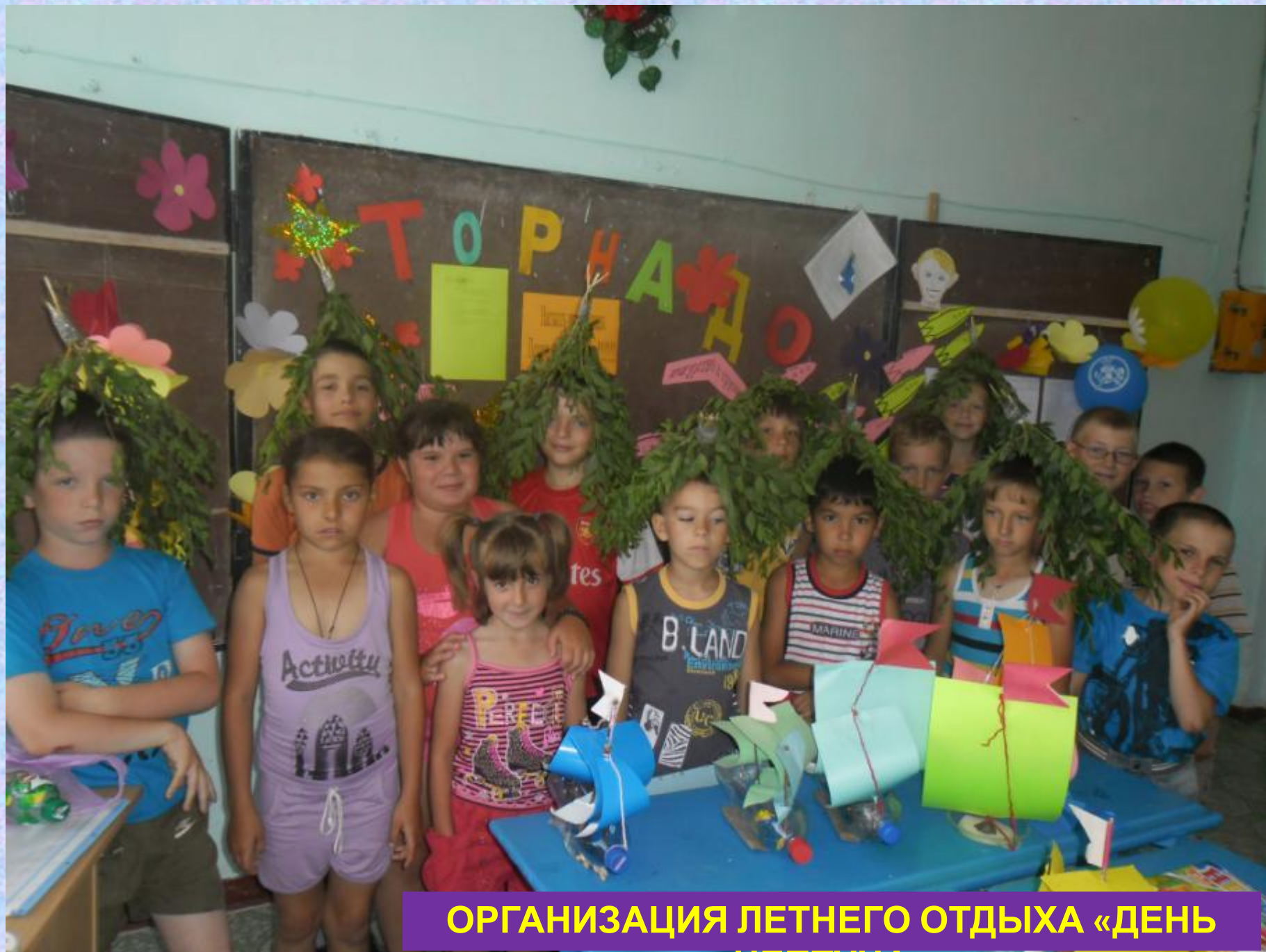
ОРГАНИЗАЦИЯ ЛЕТНЕГО ОТДЫХА «ДЕНЬ НЕПТУНА»