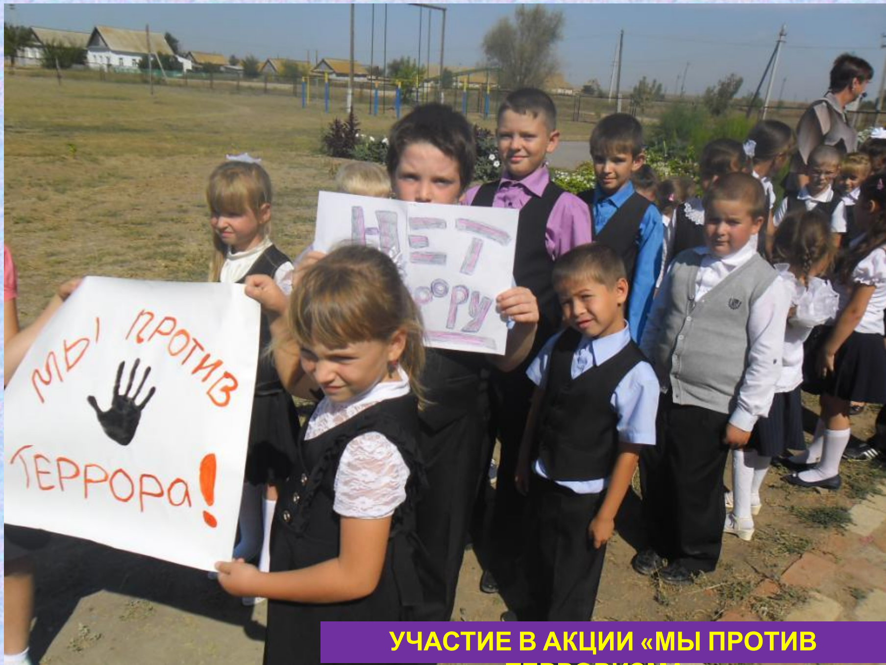
УЧАСТИЕ В АКЦИИ «МЫ ПРОТИВ ТЕРРОРИЗМА»