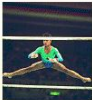
упражнения на брусках