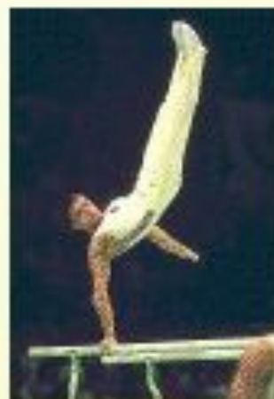
упражнения на брусках