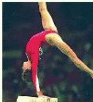
упражнения на бревне