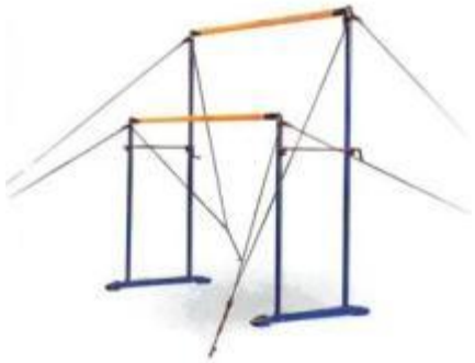
Брусья разной высоты (разновысотные брусья)