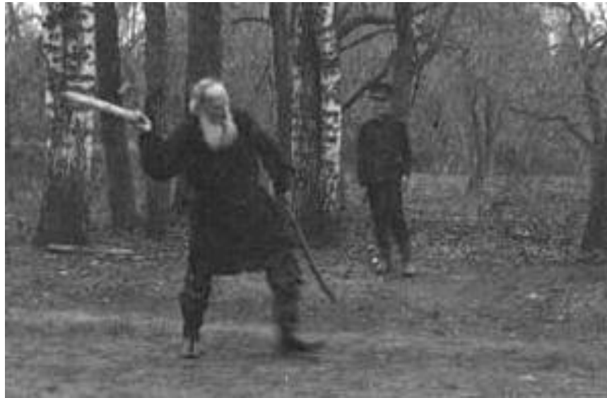
Писатель Л.Н. Толстой