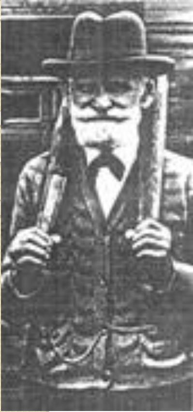
Академик И.П. Павлов