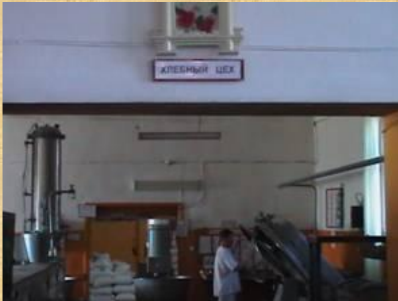
Автомат замесит тесто...