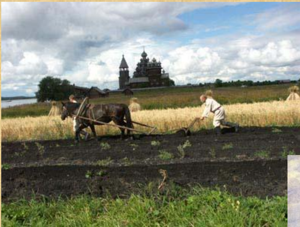
А.Г. Венецианов «На пашне»