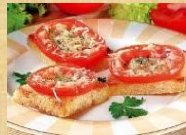
Потапцы с помидорами