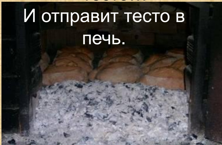
И отправит тесто в печь.