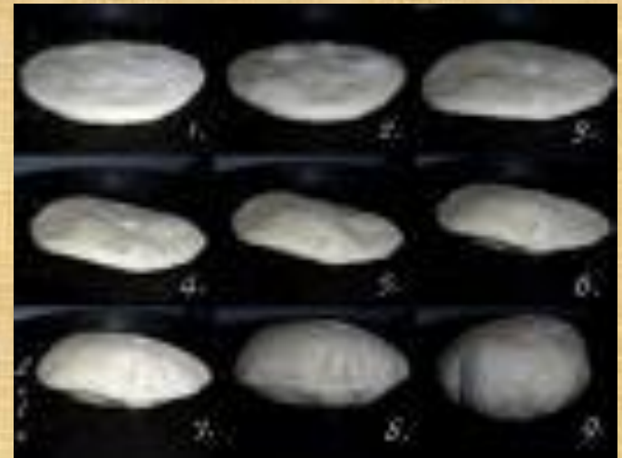
Автомат развесит и нарежет тесто...