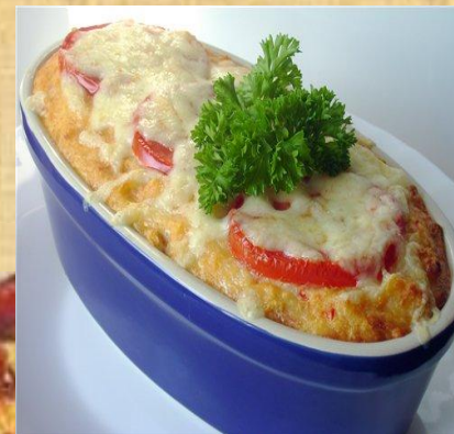
Сырный пудинг с помидорами