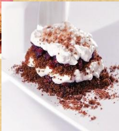
Слойка из ржаного хлеба