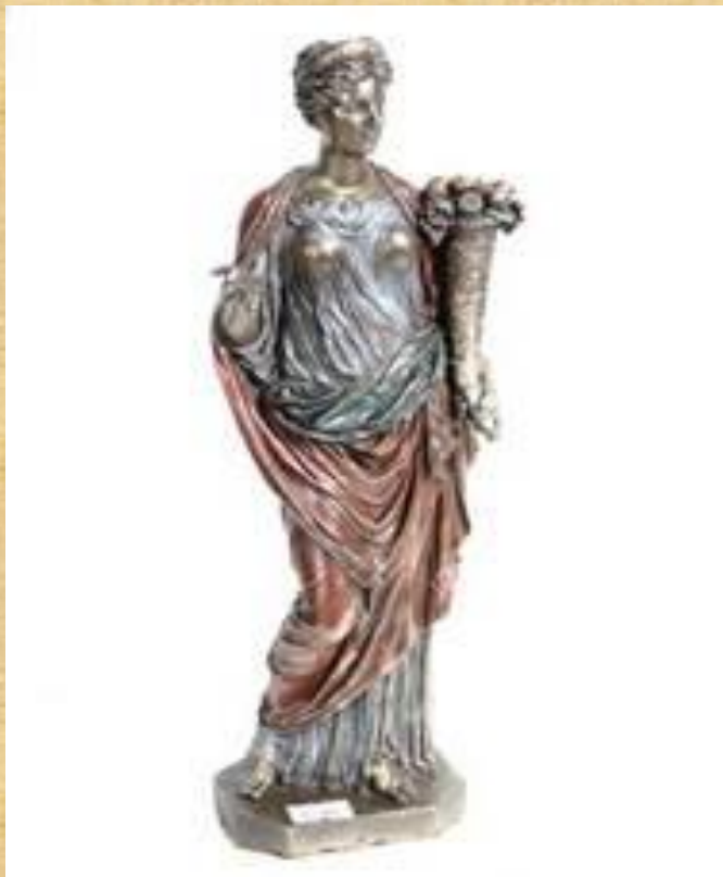
Греческая богиня плодородия и земледелия ДЕМЕТРА