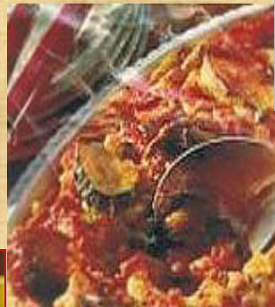
Запеканка из хлеба и цуккини