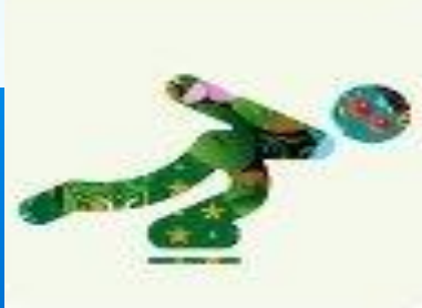
Скоростной бег на коньках