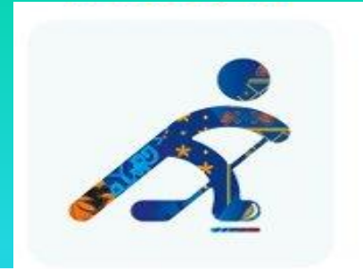
Хоккей на льду