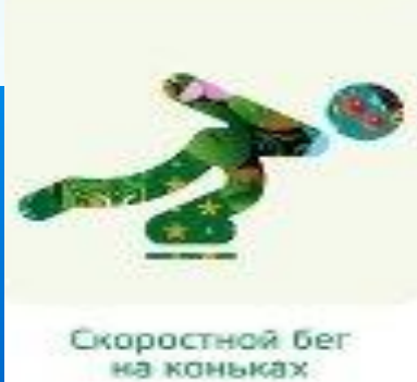
Скоростной бег на коньках