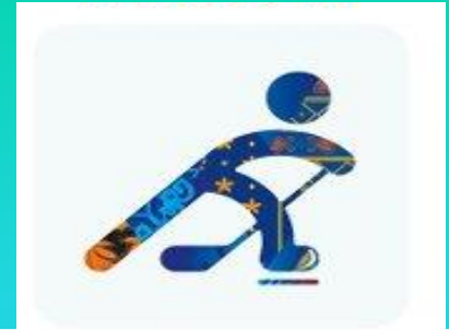
Хоккей на льду