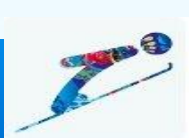
Прыжки на лыжах с трамплина