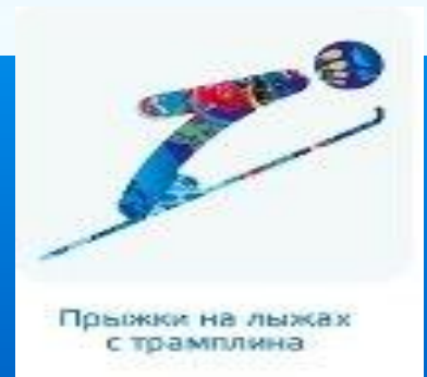
Прыжки на лыжах с трамплина