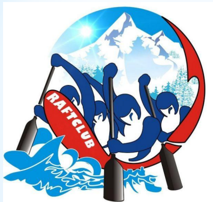
Плывущие в лодке люди