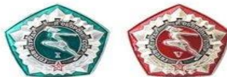
Специальная серия значков ГТО, выпущенная в честь «пяtilетки качества» (1972)