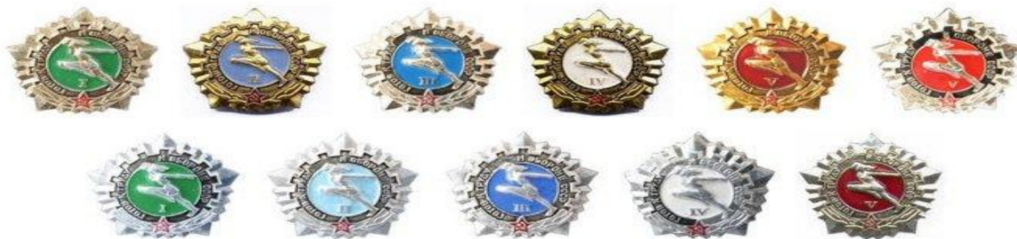
Значки ГТО, 1972 год