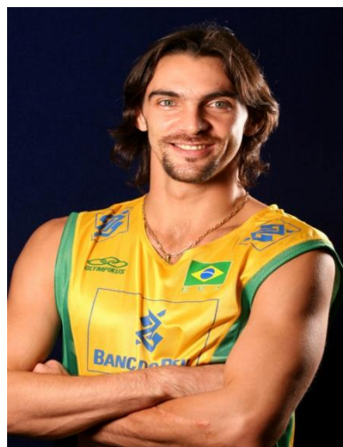
Жиба (Жилберто Годой Фильо) (Бразилия)