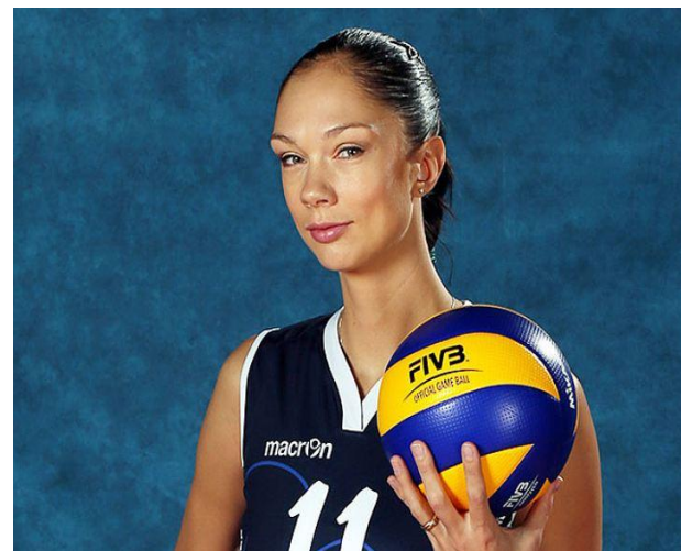
Екатерина Гамова (Россия)