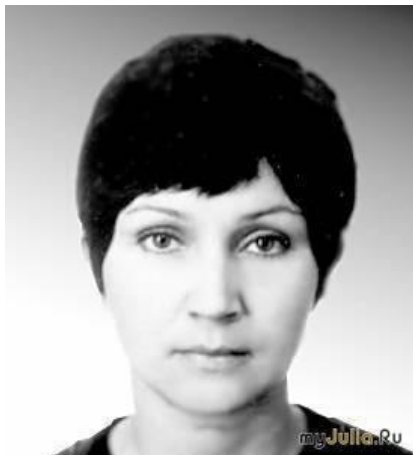
Людмила Булдакова (СССР)