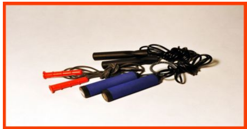
Скакалки для гимнастики