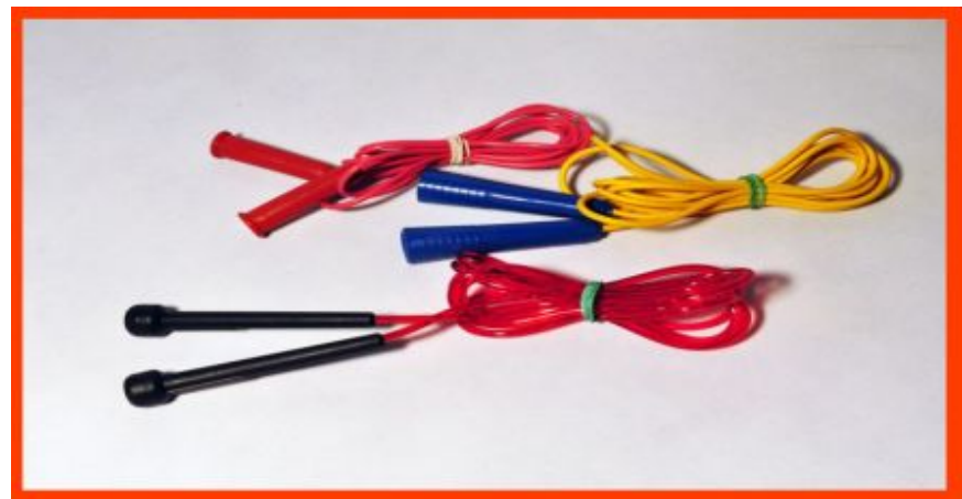
Скакалки с утяжелителями