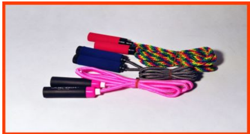
Скакалки для фитнеса