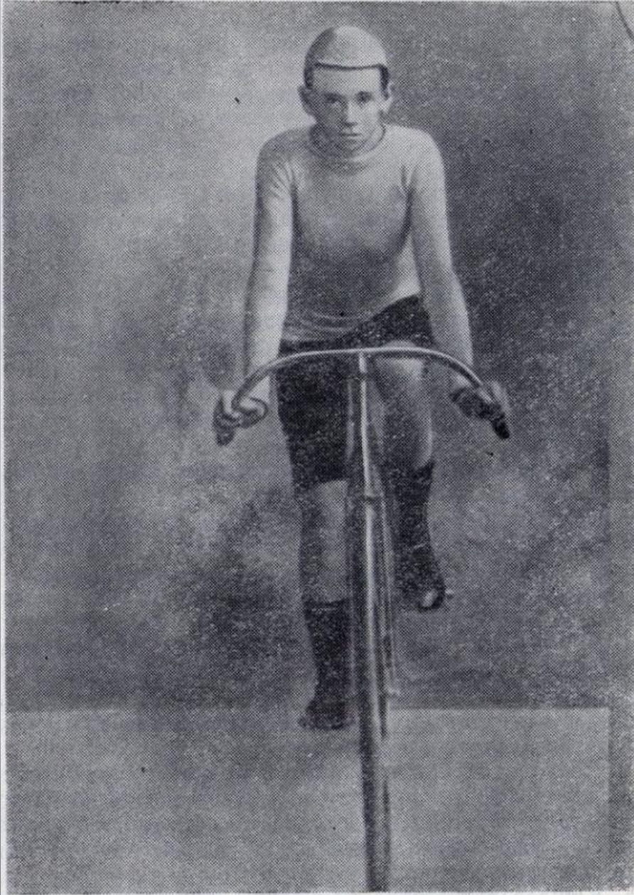
Уточкин на гоночном велосипеде в 1890 г.

В 1891 году на Ходынском велотреке состоялся первый всероссийский чемпионат по велосипедным гонкам на 7,5 верст (8000 метров).