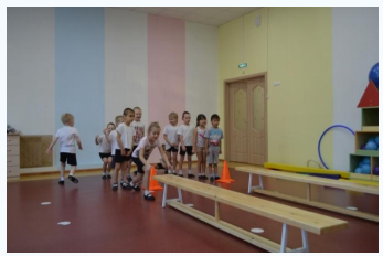
Старший дошкольный возраст