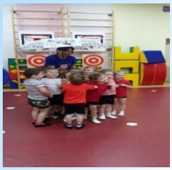
Младший дошкольный возраст