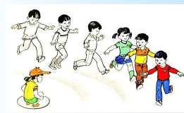
Средний дошкольный возраст